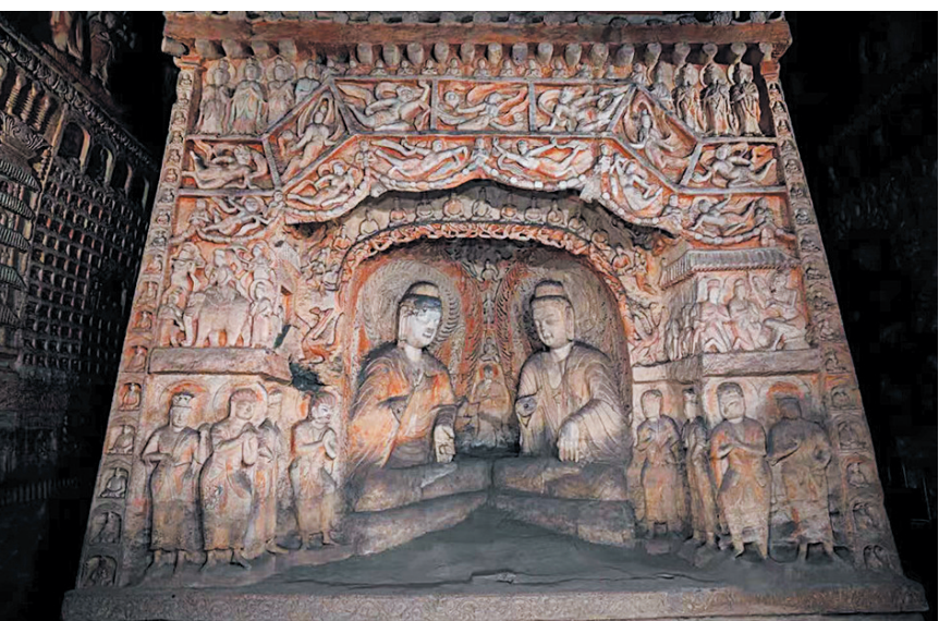
第六窟室东南西三壁中层的诸佛传场面安排的象征法华经的多宝佛塔

云冈石窟的美不只有褒衣博带式的美，还有一种气势上的美、自信的美，它是一个蓬勃向上的民族在上升期创造的艺术经典。