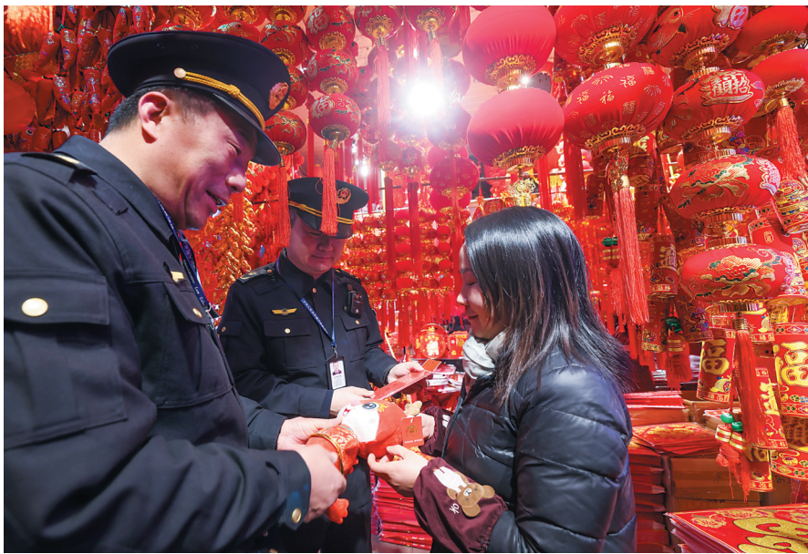
随着春节临近，浙江嘉兴的年货市场年味渐浓，嘉兴市南湖区市场监管局对全区核心商圈和重点场所开展年货市场专项检查，着力营造良好的节日消费环境。图为，执法人员在开盖小商品市场内检查节日装饰用品。

知名书画家与民辅警欢聚一堂、现场泼墨，共同迎接警察节的到来。经过两个多小时的创作，一幅幅内容丰富、寓意深邃的书画作品创作完成，作品从不同的角度展现了人民警察全心全意为人民服务的光辉形象，表达了广大群众对人民警察的崇敬和赞美。