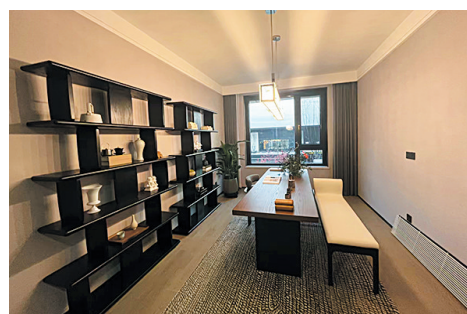
雅致书房,静享阅读时光