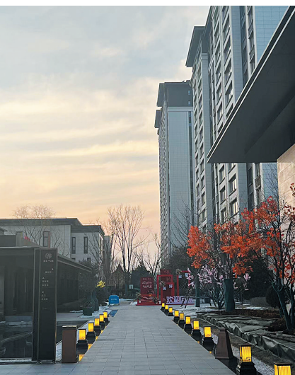
瑞湖·云山府被动房高标准呈现

瑞湖·云山府将卓越、超前的被动式科技理念融入健康生活,确保绿色、低碳、环保的被动式住宅高标准呈现,成为当前大同楼市无可匹敌的健康人居。