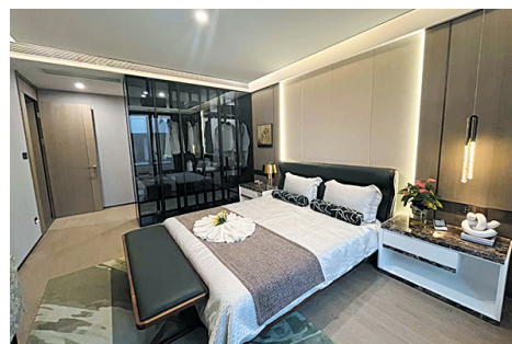
温馨卧室,独享私密空间