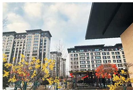
寒冷冬日,小区美景如画