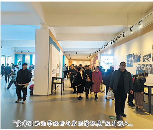
“费孝通的治学经世与家国情怀展”吸引游人。