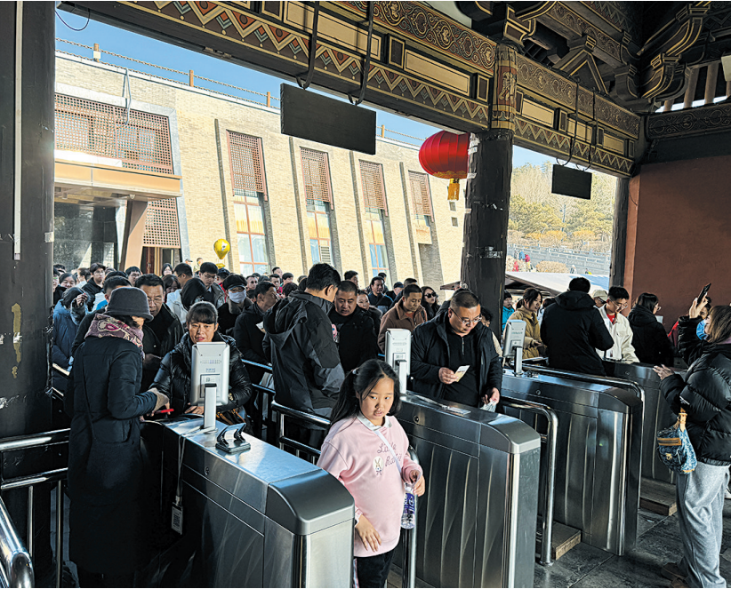
游客有序通过检票口。