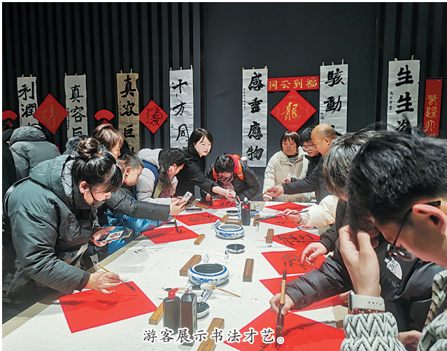
游客展示书法才艺。