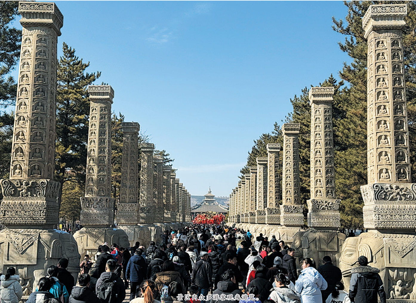
景区内众多游客观光游览。

甲辰龙年送祥瑞，云冈石窟喜迎宾。记者从云冈研究院了解到，今年春节长假，云冈石窟景区游客接待量突破23万人次，同比增长293.74%，同2019年相比增长191.02%，创历史新高。云冈旅游持续升温，众多游客将云冈石窟列为出游首选。