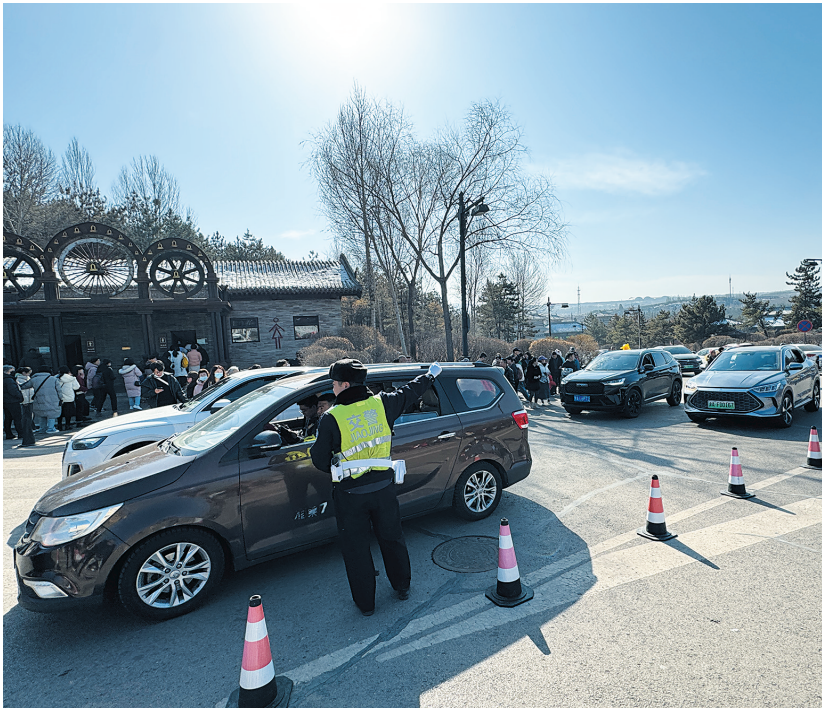
交警指挥自驾车游客有序进入停车场。