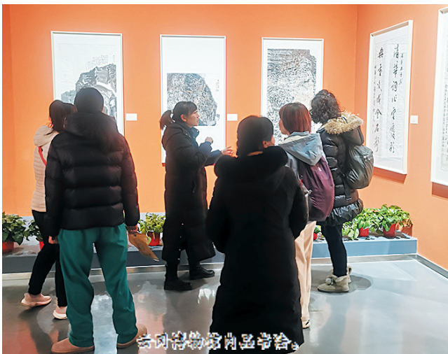
大同博物馆内品赏会。