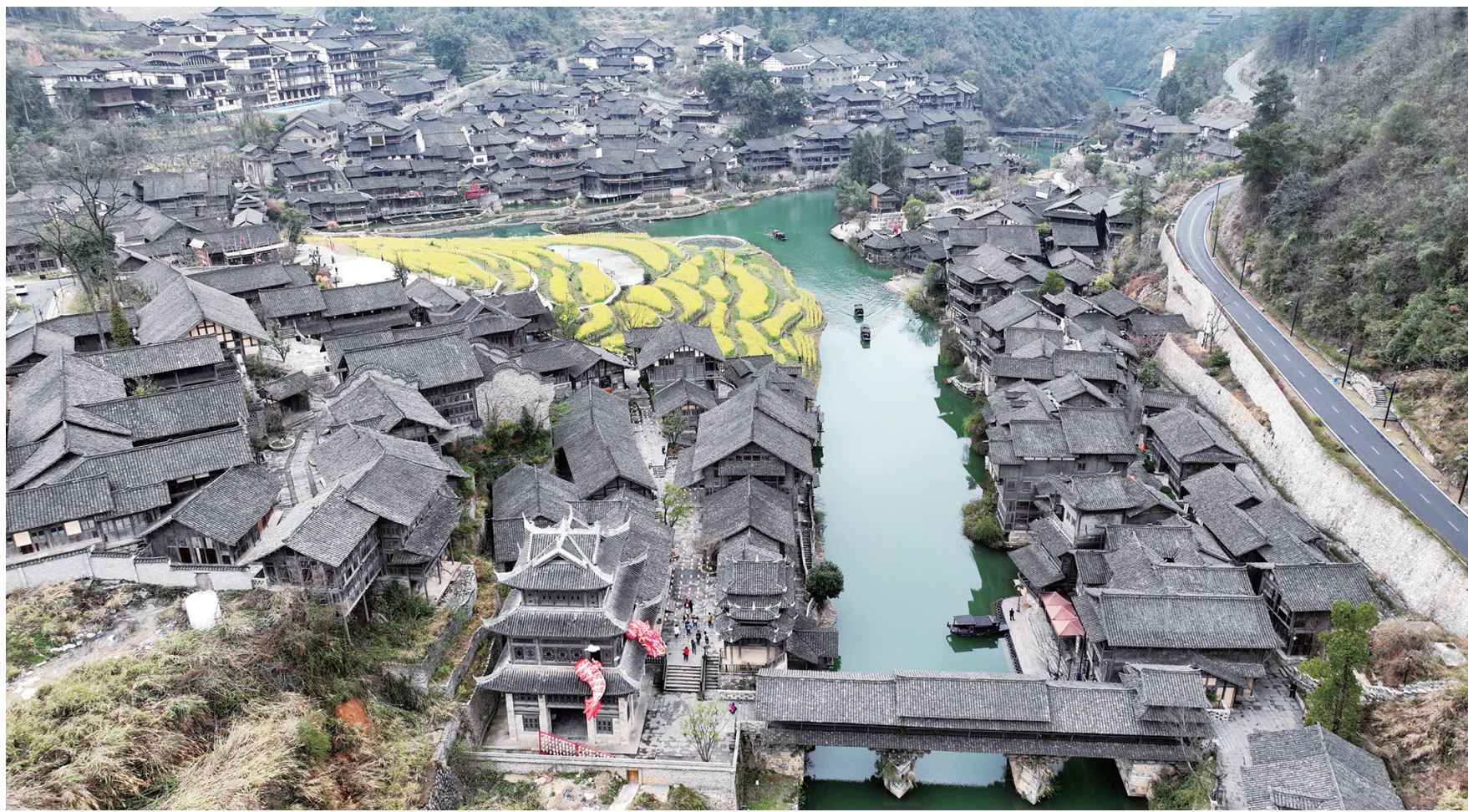
3月14日拍摄的贵州省遵义市播州区乌江景区一景（无人机照片）。春日里，贵州省遵义市播州区乌江景区吸引许多游客前来游览，乐享春光。据悉，乌江寨国际旅游度假区依托恬静的山水自然环境和浓厚的黔北村寨民俗，集观光、休闲、度假、会展为一体，成为黔北旅游的一道美丽风景。