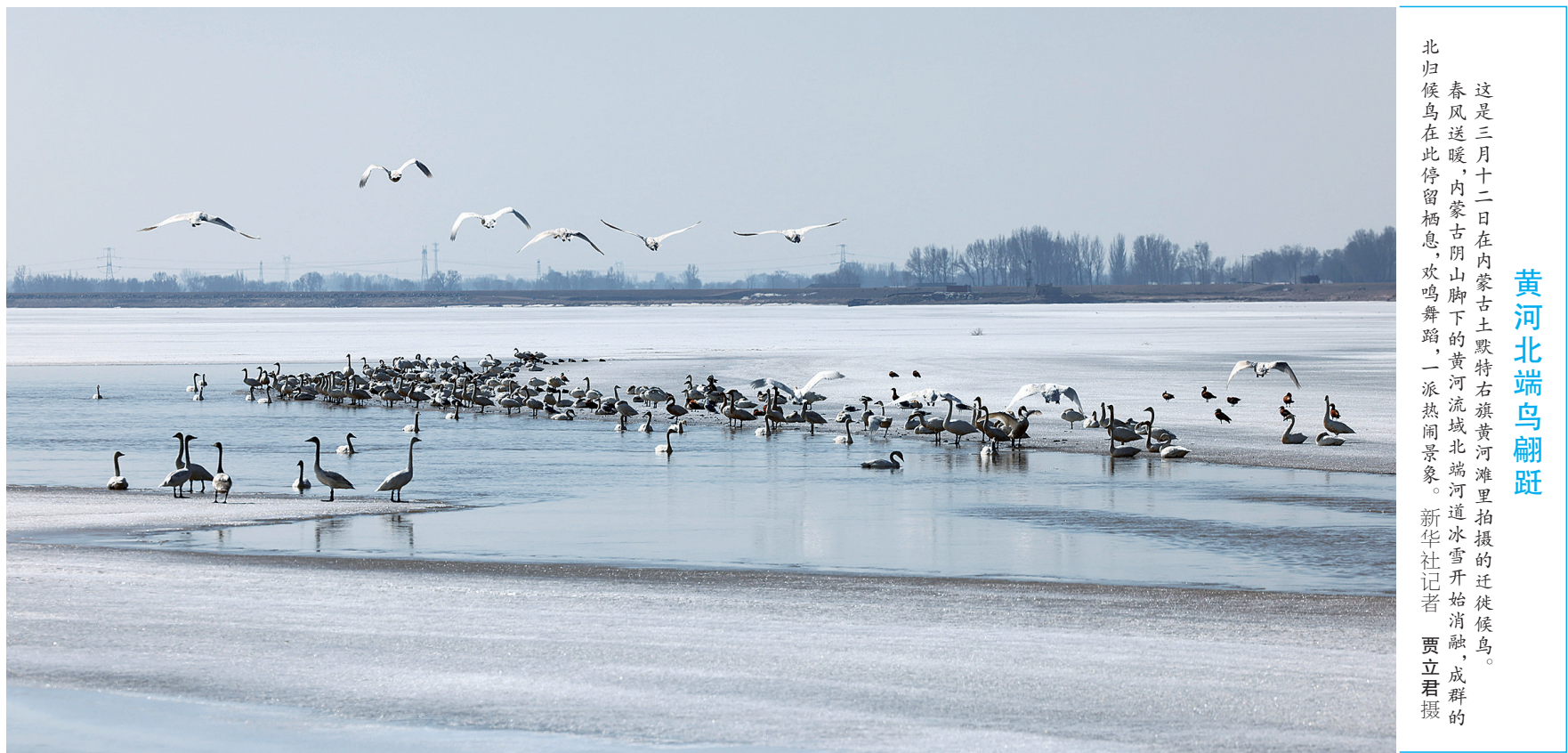
这是三月十二日在内蒙古土默特右旗黄河滩里拍摄的迁徙候鸟。春风送暖，内蒙古土默特右旗黄河滩里，一派热闹景象。