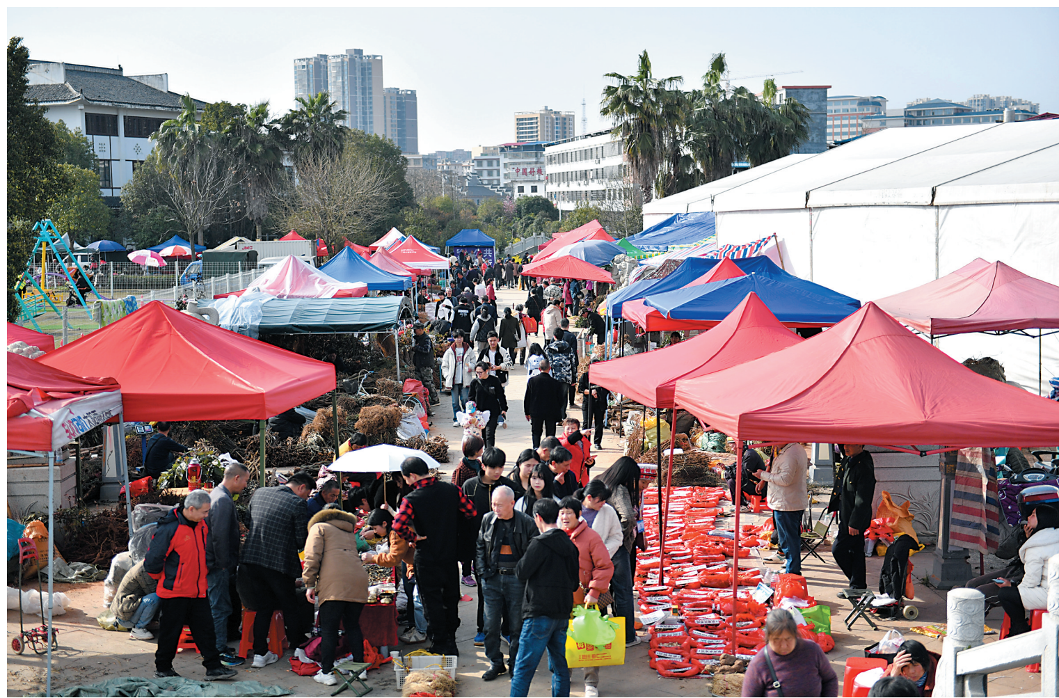
这是3月19日在安仁县拍摄的中草药交易市场。

园大力推广网络祭扫、鲜花祭扫、家庭追思等文明低碳祭扫方式，严防使用明火，共同维护绿色环保、优美整洁的环境。为给前来祭扫人员提供便利，清明祭扫期间，该陵园实行全员上岗，在做好应急处置、值班值守、安全防范、活动组织等工作的同时，实行24小时值班和重大事故报告制度，落实落细祭扫服务保障管理措施。此外，祭扫人员需持《大同市革命烈士陵园安魂卡》或相关手续入园。