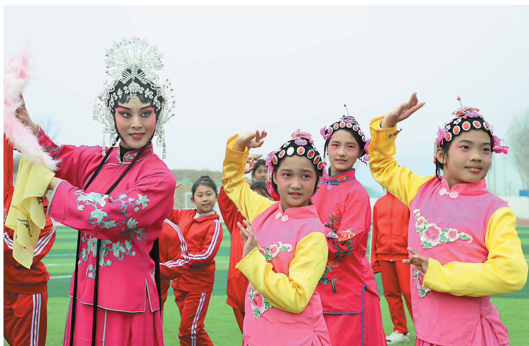
3月26日，在河北省唐山市丰润区泉河头镇团山子小学，评剧演员在教学生戏曲动作。

本报讯（记者 张鑫）为进一步筑牢食品安全关，守护人民群众“舌尖上的安全”，近日，云州区人民检察院公益诉讼部门深入辖区食品加工企业，开展食品安全专项检查活动。 该院公益诉讼部门深入生产一线，重点查看了企业证照是否齐全、从业人员是否持证上岗、进货查验及台账登记是否完整，并对食品生产车间是否符合卫生标准、食品外包装生产日期有效期等信息是否完整、生产原料的贮存条件是否符合相关规定和标准等方面进行了详细查看；与企业负责人进行座谈交流，详细了解了食品研发、生产加工标准及生产经营中的实际司法需求，提醒企业落实好食品安全主体责任，督促及时开展自查，切实守护广大人民群众“舌尖上的安全”。