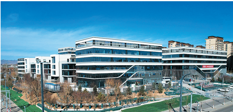
雄踞御东核心 助跑企业腾飞

在全球及国内一线城市，独栋总部已经成为和CBD并驾齐驱的办公物业。独栋花园办公成为商务人士的终极办公之所。大同总部壹号作为大同新型办公总部集群，为企业提供开放的空间、优美的环境，无论是工作其中抑或偶然驻足，都能得到愉悦的享受，使员工的“智慧生命力”更加旺盛。工作效率的提高，代表着企业效能的提高，更代表着企业卓越的未来前景。目前，已有10多家企业率先入驻，大同总部壹号全国火热租售中。