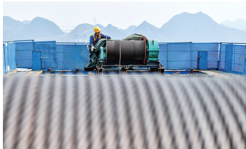
3月27日，工人在花江峡谷大桥的桥塔顶上施工。花江峡谷大桥是贵州六安高速公路的控制性工程，建于被称为“地球裂缝”的花江大峡谷之上，全长2890米，主桥桥面与谷底的北盘江水面垂直高度达625米。大桥建成后，将超越北盘江大桥，成为世界第一高桥。自2022年1月花江峡谷大桥正式开工建设以来，贵州桥梁集团等承建单位的建设者们不畏严寒酷暑，奋战在花江大峡谷600多米的云山雾海里，为大桥早日建成攻坚克难、不懈努力。

强化监督检查。按照监督“全方位、全过程、全覆盖”的要求，做细做实监督检查。加强专项检查监督，把惩治“蝇贪”同扫黑除恶结合起来，把“清”和“廉”的要求贯彻到基层公权力运行的各个环节，把“小微权力”落实纳入村