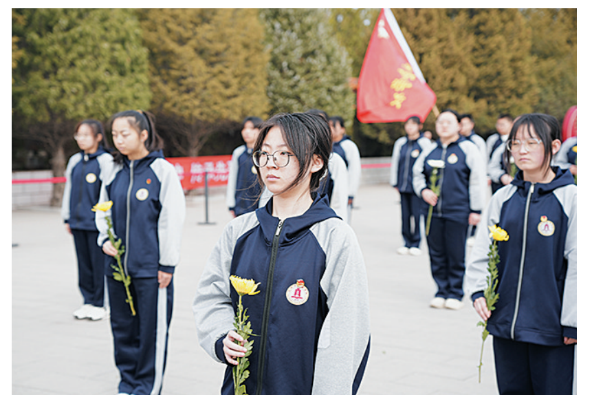
同学们手持鲜花,致敬革命先烈

此次活动的开展,使团员青年们接受了一次生动的爱国主义教育和“沉浸式”的精神洗礼,深刻体会到幸福生活的来之不易。大家纷纷表示:“有革命先烈榜样所赋予的力量,我们有勇气,也有信心面对和战胜一切困难。我们将永远铭记革命先烈的英勇和壮举,坚定理想信念,树立远大志向,刻苦学习,做有理想、敢担当、能吃苦、肯奋斗的新时代好青年。”