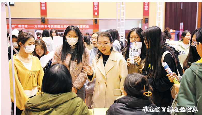
学生们了解企业信息

下一步,大同幼师将持续开展演讲比赛、主题读书月、阅读成果展示等活动,不断提高学生的阅读兴趣和阅读能力,助推书香校园建设。