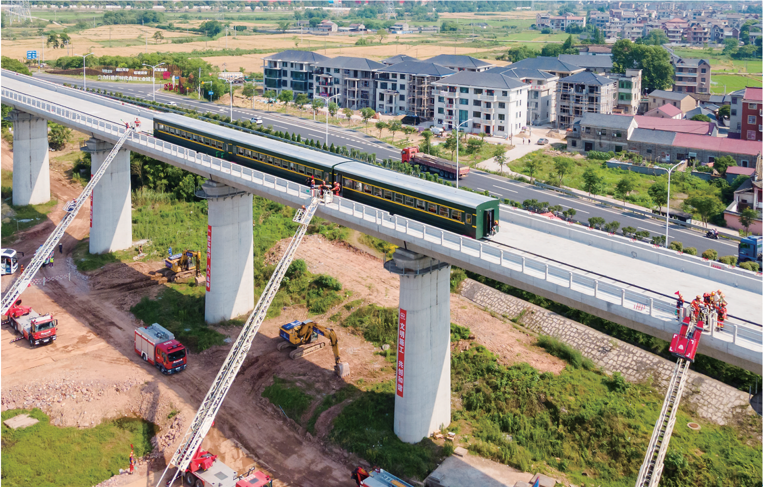
5月10日，在浙江金华主演习场，参演人员开展救援演习（无人机照片）。

泛化国家安全概念，滥用出口管制措施，打压遏制他国企业，严重损害企业合法权益，破坏全球产业链供应链安全稳定，阻碍世界经济复苏和发展。中方敦促美方立即停止错误做法，并将采取必要措施，坚决维护中国企业的合法权益。