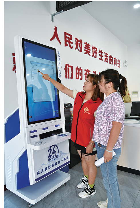
云兴街社区政务服务智慧管理平台

全面实施乡村振兴“千万工程”示范项目。谋划实施“数字乡村”工程,年内建设3个精品示范村、24个提档升级村,全力打造宜居宜业的和美乡村。三是全力做好普惠性、基础性、兜底性民生工作。分批次启动压覆煤炭村搬迁安置工作;加快县域网建设,推动万家寨引黄北干支线加快建设;统筹推进城建、就业、教育、医疗、住房等民生实事,解决好民生难题、补齐民生短板,优化民生服务。