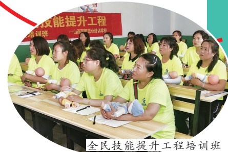
全民技能提升工程培训班

星光不问赶路人,历史属于奋斗者。站在新征程上,左云县将继续踔厉奋发、勇毅前行,一步一个脚印,围绕谱写富裕美丽幸福平安的