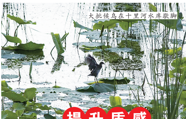
大批候鸟在十里河水库歇脚

化旅游产品和服务为形式、以满足人们文化消费和旅游消费为目的的新型产业形态。今年,左云县将抢抓全省长城旅游板块建设机遇,统筹策划、精准定位,借力打力、造势拓展,要素融合、高点起步,加快长城国家文化公园(左云段)基础设施建设,打造长城边塞游、生态康养游、露营小镇游、卧牛古城游、火山石林游等文旅项目,不断丰富旅游业态,让文旅产业活起来、火起来,全力打响最具地方文化内涵和个性风情的旅游品牌。同时,通过举办全国性自行车赛事和名人书画摄影采风以及文学作品笔会等活动,让外部目光聚焦左云,让左云风光名扬四海八方。