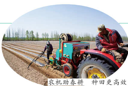
农机助春耕 种田更高效

目,带动种植10万亩优质葵花,加快打造以葵花种植、加工、销售、观光为一体的葵花专业镇;在牛羊养殖及加工产业中,实施“雁白云羊”新品种培育推广和优种绵羊种羊推广项目,引进凯盛源牛羊屠宰精加工项目,打造全省重要的种羊、肉牛繁育加工基地;在特色农产品加工业中,借助“左臻·云品”区域公用品牌,做大做强乡村振兴产业园,打响雁门清高、雁门古道、云中紫塞、白羊大地等特色农产品品牌,把龙头企业带动辐射作用与千家万户的生产经营有效对接起来,促进广大农民稳定增收。