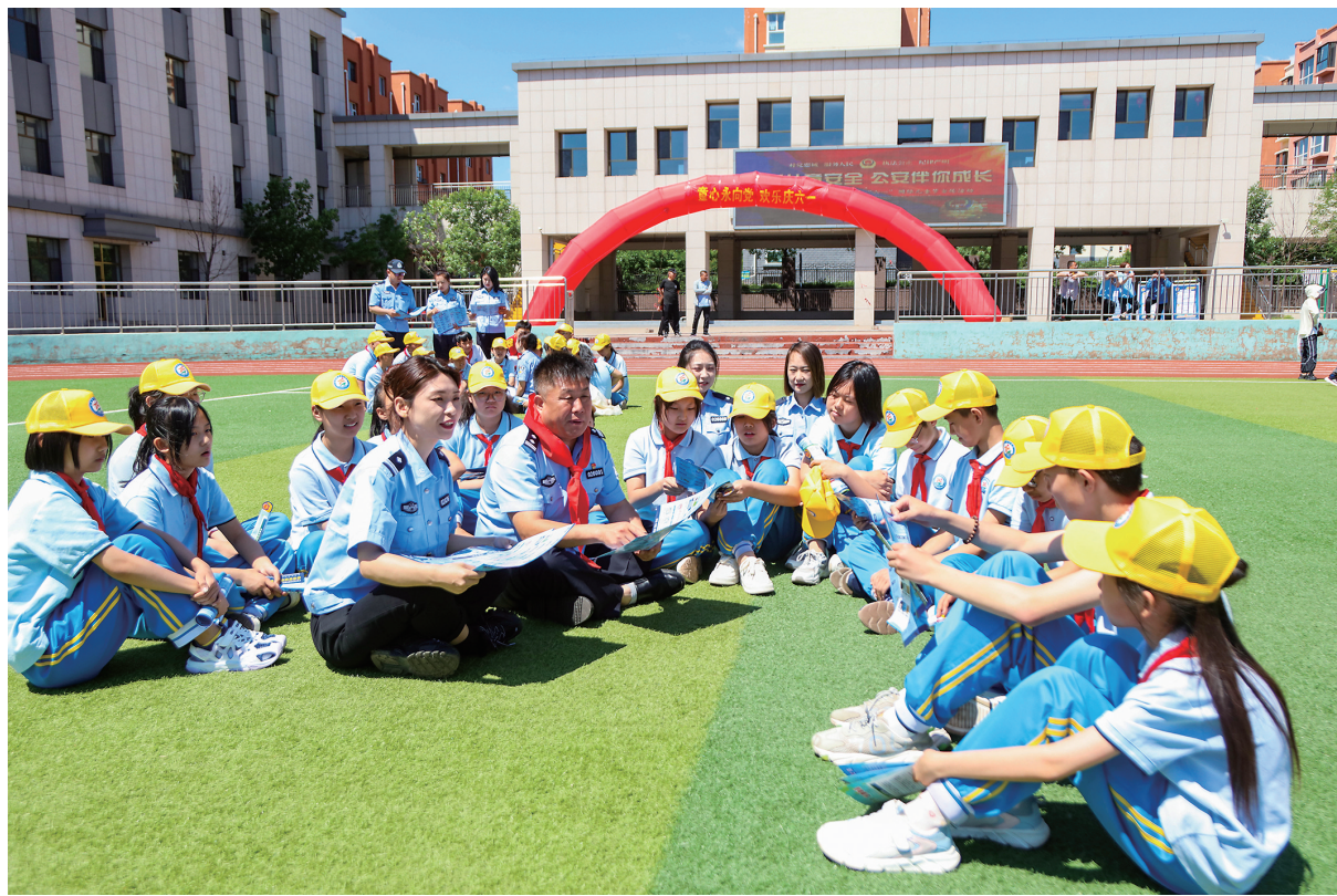
5月31日,市公安局云冈分局与天沐小学携手,共同举办了“关爱儿童安全 公安伴你成长”主题宣传活动。民警通过宣传资料、布置展板、表演情景剧等方式,让学生们了解反诈、禁毒、防范校园欺凌等安全常识,增强安全防范意识。图为民警正在向学生们传授反诈技巧。

该院儿科住院大楼也充满了节日氛围,一场“童心童趣”绘画比赛吸引了众多小朋友参加,他们发挥想象力,将心中的童真和梦想展现得淋漓尽致。一位患儿家长说:“孩子生病来医院治疗,没想到医院贴心地为他们准备了节日礼物,不仅安抚了他们的情绪,我们心里也感到很温暖。”