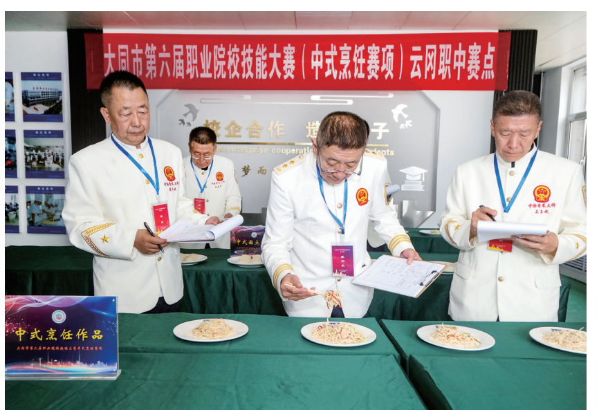
6月4日,全市第六届职业院校技能大赛(中式烹饪赛项)在云冈区职业中学举办。本次比赛由市教育局、市人社局、市总工会、团市委主办,设中式热菜、冷拼雕刻、中式面点三个分赛场,来自我市各职业院校的18名选手参赛。本届大赛不仅为职业院校学子提供了展示才华、锻炼能力的舞台,更激发了他们对专业技能学习的热情和追求。图为评委对参赛作品进行考核打分。本报记者 韩莹摄

近日,市住房公积金管理中心接到一位破产企业缴存职工的求助电话,该职工因行动不便,无法到业务大厅现场办理住房公积金退休提取业务,且不会通过线上渠道办理。该中心负责人了解到这名职工的求助信息后,委派相关部门第一时间联系该职工,登记其家庭