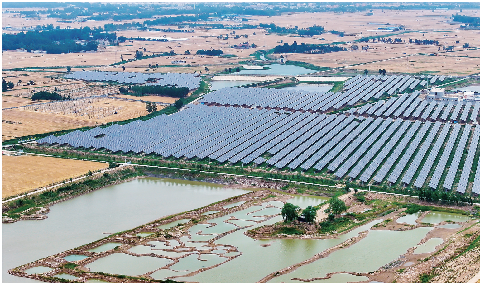
6月4日拍摄的嘉祥县梁宝寺镇利用采煤塌陷区建设的华能嘉祥梁宝寺光伏电站项目(无人机照片)。山东省济宁市嘉祥县统筹推进采煤塌陷区综合治理与清洁能源开发,2023年引入中国华能集团在梁宝寺镇采煤塌陷区建设集光伏发电、农业种植于一体的“农光互补”光伏电站项目,提升采煤塌陷区综合利用效能,助力乡村振兴。

“园区的发展离不开我市长期以来对民营企业的重视支持与营商环境的持续改善。”齐俊斌表示,万昌将承担起民营企业发展的责任,主动融入全市经济发展大局,进一步构建物流信息网络体系、物流供应链体系和物流集成化体系,推进数字化物流园区建设,打造立足晋冀内蒙古、覆盖全国的物流枢纽园区。