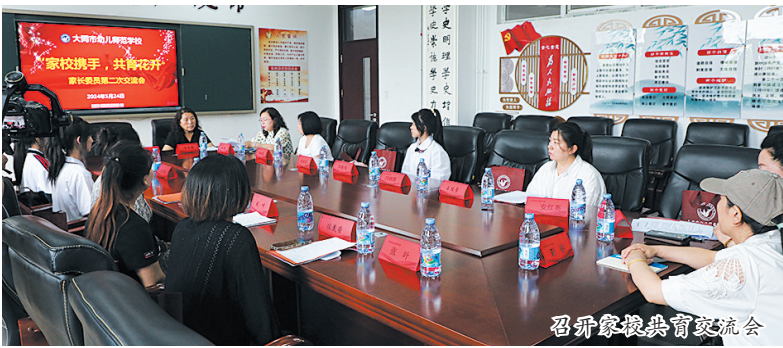
召开家校共育交流会