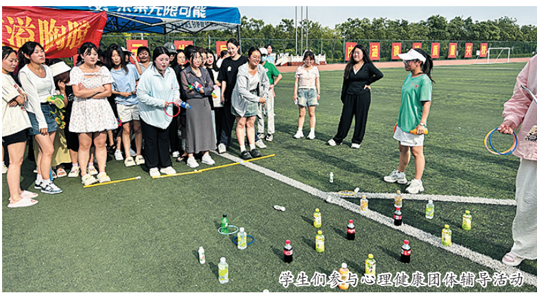
学生参与心理健康团体辅导活动