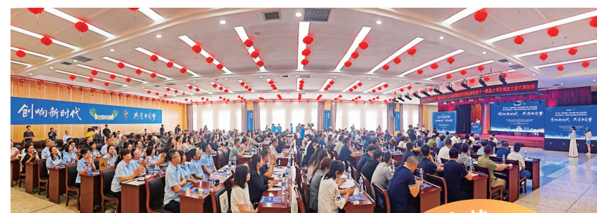
6月12日，第六届“中国创翼”创业创新大赛山西选拔赛暨山西省第十一届星火项目创业大赛大同初赛启幕。