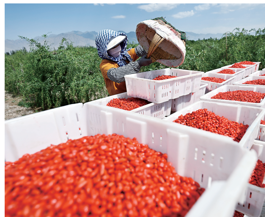
6月12日，采摘工将采摘的枸杞集中装箱。

二是强化组织领导，严格责任落实。市城联社始终把党建工作作为推动各项工作的总抓手，（下转第三版）