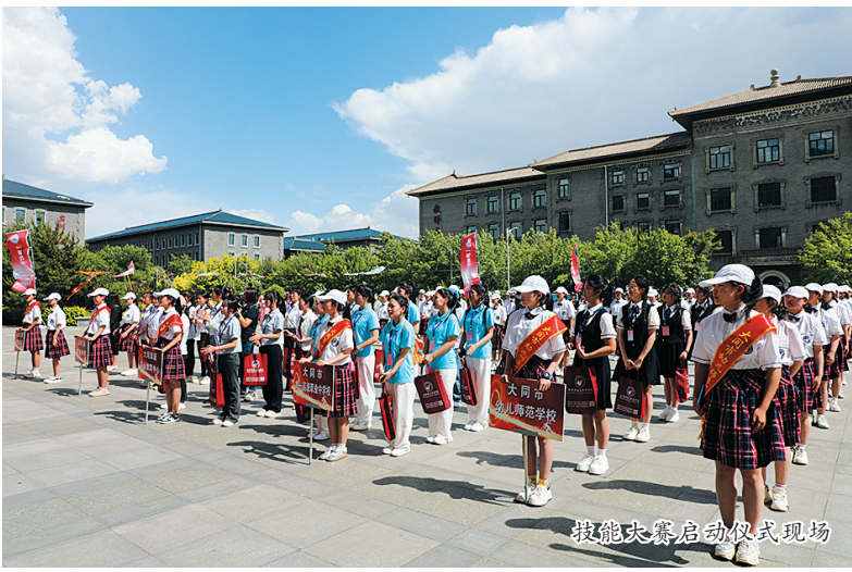
技能大赛启动仪式现场