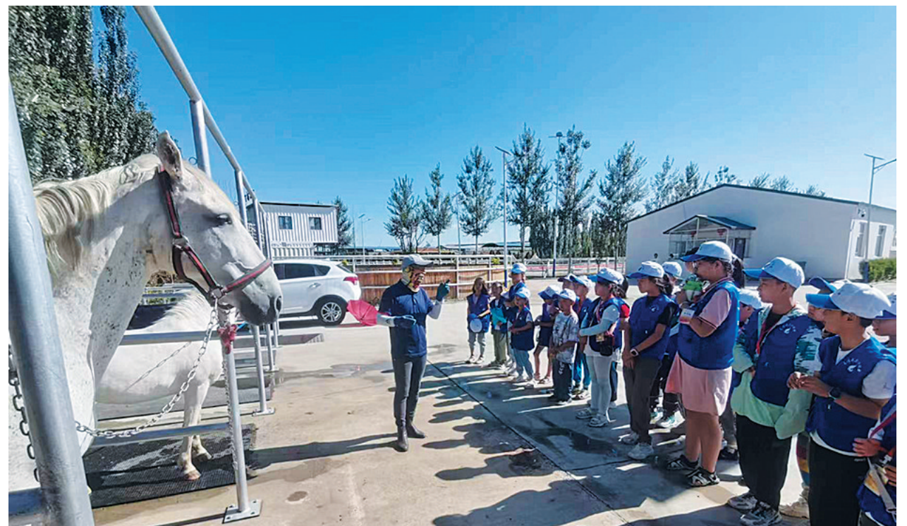
小记者们正在学习马术知识

近日,50余名大同日报小记者来到云中飞扬牧场,学习马术基本知识,感受马术运动的魅力。 活动中,专业教练详细讲解了马术运动的起源与发展,并向大家介绍了马术装备功能。骑马体验环节,小记者们穿好骑行装备,在教练的指导下,学习基本的骑乘技巧,纵情体验马术运动的乐趣。