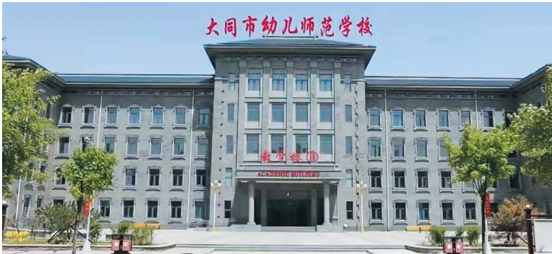
大同市幼儿师范学校

承办工作,在赛前成立工作小组,多次组织召开专题会议,制定详细的竞赛指南和工作方案,从赛程安排、场地布置、后勤保障等方面做出细致安排,全力保障赛项顺利进行。 据了解,大同幼师秉承“以考促学、以赛促教、立德树人、多元发展”的办学理念,不断加强日常教学管理,完善“岗课赛证”综合育人机制,把技能大赛作为深化教育教学改革、创新人才培养模式、提高人才培养质量和提升学生就业质量的重要平台。下一步,该校将继续以技能大赛为抓手,通过创新竞赛方式、丰富竞赛内容、优化教学模式、加大实操技能培训等,全面提升师生专业技能水平和职业素养。