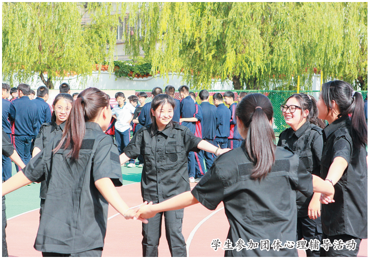
学生参加团体心理辅导活动