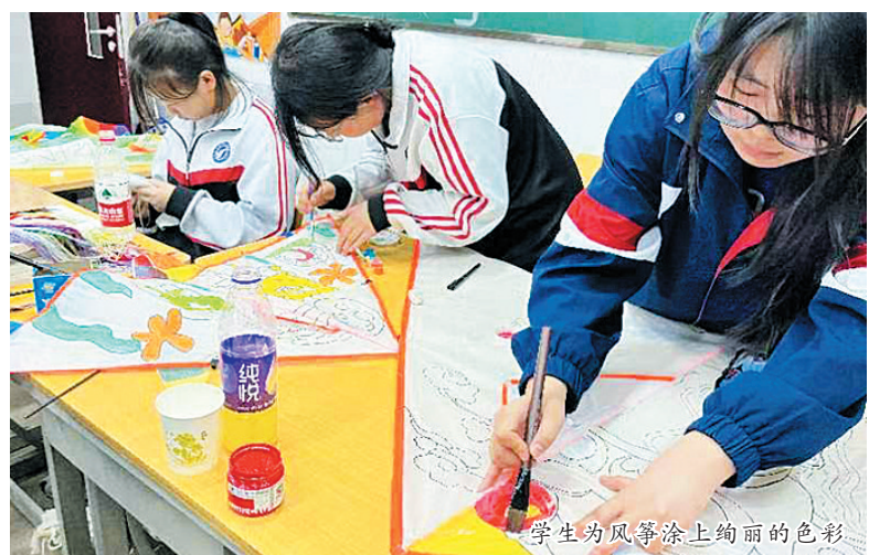
学生为风筝涂上绚丽的色彩

据了解,大同幼师充分挖掘校园资源,将各类特色课程与教育教学相融合,在课外时间组织开展内容丰富、形式多样的特色育人活动,助力学生全面发展。接下来,该校还将创新活动形式和内容,吸引更多的学生参与其中,不断满足学生个性化发展需求。