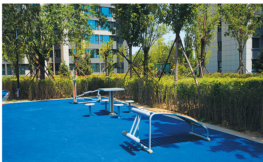
公园住宅 居繁华揽繁花

安家公园旁,繁茂的树木、花草就相当于一座可以造氧、调节湿度的天然氧吧,让人们可以尽情享受新鲜时光,开启绿色健康颐养生活。树木葱翠的公园还是一道减少噪音的屏障,与其要出门才看到风景,不如把家安在风景旁。坐拥城市繁华,奢享公园宁静,静静感受自然四季的每一种形态,刚好不辜负这生活的馈赠。