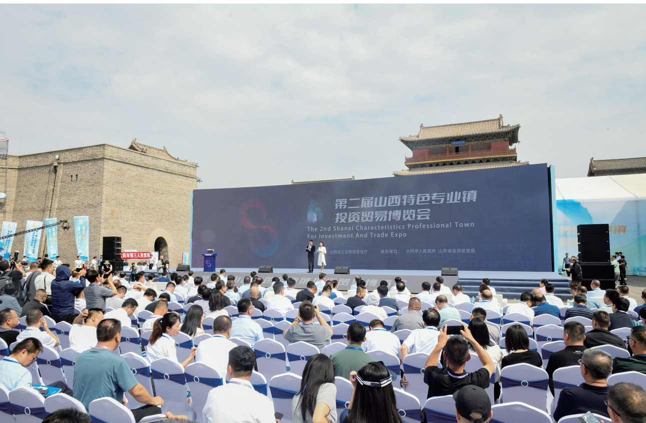
昨日，第二届山西特色专业镇投资贸易博览会启幕。