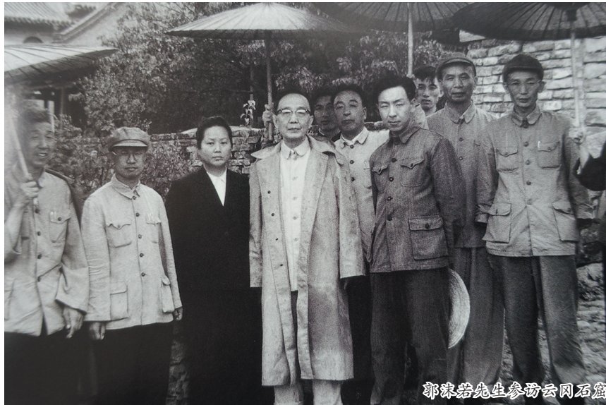
郭沫若先生参访云冈石窟

前两句写实，后两句抒情，既有细雨，又见万佛，烟雨蒙蒙，山河壮阔。然而，在人民大众无穷的智慧和力量面前，郭沫若先生发出了“佛法何足道”的感叹，既为古代开窟造像的无数工匠代言，也礼赞了今日广大劳动人民的卓越与伟大。郭沫若先生学识超群、文采斐然，此诗虽平易易懂，但有喷薄的豪情，像他早年写下的著名诗作《女神》，大气磅礴、激情洋溢，让人感到富于创造精神的诗人郭沫若并未老去。 之后，他又为云冈石窟文物保管所题词： 云冈石窟固系石灰岩与砂岩，风化水蚀使雕塑品多被毁损，至为可惜。然最可恨者，为帝国主义文化侵略之人为破坏。从事保护文物的同志，于维护保护之外，宜注意进行缜密的调查研究，并根据事实，揭发帝国主义分子之盗窃破坏行为，撰为著述，公诸于世。不但可以增进人们爱护文物之热情，亦可以激起反抗帝国主义之愤慨。望同志们把这责任切实担当起来，共同努力。 情之所至，语重心长。 于立群女士题曰： 看到古代雕刻的杰作，令人感到劳动人民创造力的伟大。 他们伉俪二人为云冈石窟的题