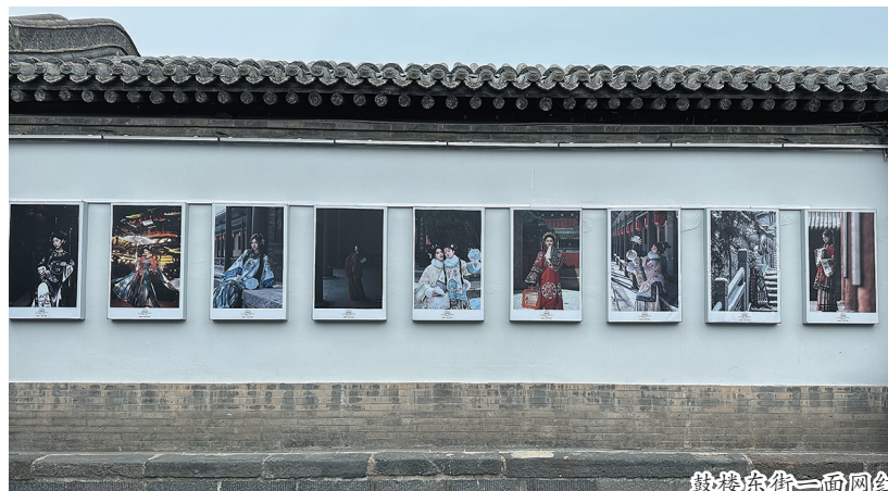
鼓楼东街一面网红墙成为游客打卡地。