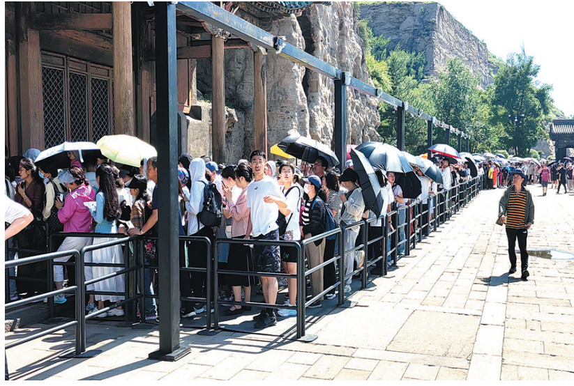
暑期云冈石窟游人如织。

旅游，不仅让城市更加繁华，也让我们生活更加丰富多彩。2024年山西省旅游发展大会确定主题为“旅游让生活更美好”。