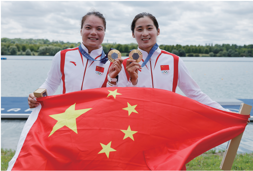
▲ 8月9日,中国组合徐婷晓(左)/孙梦雅在颁奖仪式后。当日,在巴黎奥运会皮划艇静水女子双人划艇500米决赛中,中国组合徐婷晓/孙梦雅夺得金牌。