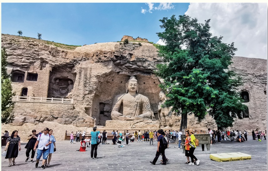
云冈石窟吸引了国内外游客关注。

我市提出要在国际知名文化旅游目的地建设上争做示范区,发挥大同文旅资源富集优势,继续打好“云冈、恒山、古城、长城”及平型关“4+1”文旅牌,持续叫响“文化古都、清凉夏都、美食之都”品牌,努力把大同打造成为国际知名文化旅游目的地。 随着我市的文旅事业不断创新,更加彰显出非凡而独特的城市魅力,内蕴的精彩纷呈与勃发的文化活力吸引着四海宾朋前来感受文化古都的大不同。