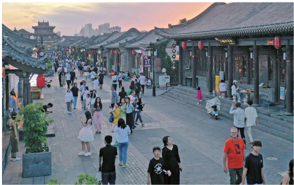
历史文化厚重的鼓楼西街。

游客来到殿宇嵯峨、气势雄伟的华严寺,如同亲临艺术宝库,震撼之情伴随始终。这座始建于辽重熙七年(公元1038年)的古刹内,值得驻足仰止的内涵太多。上寺主殿大雄宝殿气势弘阔,占地1559平方米,是我国最大的佛殿;位于大雄宝殿顶部的琉璃鸱吻工艺考究、造型精美,两只鸱吻各高4.5米,皆为我国古建筑中最大的琉璃吻兽,两大全国之最堪称“古建神品”。下寺大殿薄伽教藏殿内,殿内侧沿壁排列重楼式壁藏38间,整个壁藏和天宫楼阁是国内唯一规模宏大的壁藏制作,著名建筑学家梁思成称其为“海内孤品”。薄伽教藏殿宽阔的佛坛上布列辽代塑像三十一尊,技法娴熟,具有极高艺术价值和历史价值,其中的合掌露齿菩萨被誉为“东方维纳斯”,堪称“辽绝品”。 寺内华严宝塔虽是修复,亦是经典。其是继应县木塔之后全国第二大纯木榫卯结构的方木塔,包括塔刹在内总高43.5米,为三层四檐攒尖顶,均按辽金时期建筑手法营造。在宝塔底