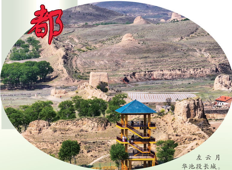
左云月华池段长城。

振奋人心的情景演绎、丰富多元的特色展陈、寓教于乐的军事体验……入夏以来,灵丘县平型关大捷景区人潮涌动、游人如织,景区内丰富的游览体验更是推动红色旅游持续“出圈”。 近年来,灵丘县围绕平型关丰富的红色文化资源,整合白崖台、小寨等红色旅游资源,着力打造红色文化名片。如今,这些红色旅游资源丰富的村庄成了集餐饮、住宿、休闲、观光、旅游为一体的红色文化村,不仅让文旅产业富有内涵,而且助推红色旅游与全域旅游融合发展。在平型关大捷主战场乔沟入口处的门区广场,由百灵鸟艺术团打