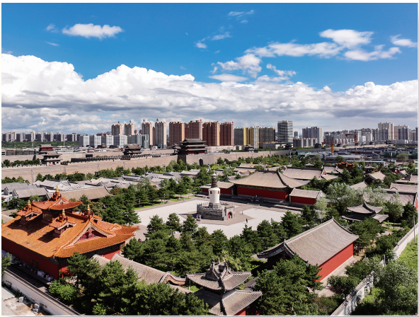
蓝天白云掩映下的法华寺。

部,有一处近500平方米的千佛地宫,采用100余吨纯铜打造而成,为中国最大且纯粹的铜造地宫,令人震撼赞叹。 与壮阔的南城墙交相辉映的善化寺,保存着4座辽金木构,均为中国古建最高等级庑殿顶,令许多古建爱好者大为赞叹。在南城墙之上俯瞰善化寺,所见建筑群沿中轴线坐北朝南,渐次展开,层层迭高,宁静肃穆、古朴恢弘之大美摄人心魄。寺内的辽金彩塑艺术精品佳作众多,颇值细细品鉴。三圣殿内南宋朱弁撰写的《大金西京大普恩寺重修大殿记》,则让人回想当年颇具传奇的历史故事。 古城内的经典古建星罗棋布,颇值驻足细赏。关帝庙武圣殿为元代遗构,让人领略元代古建筑的雄浑和巨壮。大同府文