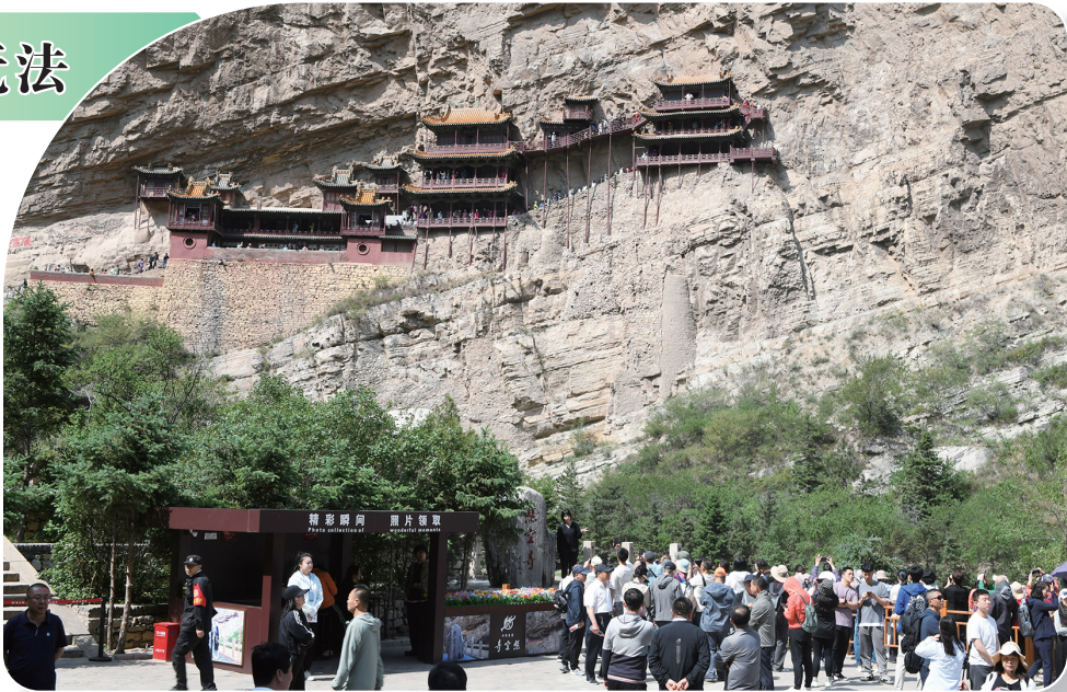
悬空寺成为游客的必到打卡地。

五岳归来不看山。素有“绝塞名山”美誉的北岳恒山,一直是大同文旅的地标。恒山自然风光优美,巍峨耸峙、壁立千仞,奇岩怪石各呈异状,形成独有的“版画式”山貌,人文景观丰富多彩,是游客来大同必到的打卡地,特别是进入暑期,北岳恒山成为游客避暑纳凉、休闲度假、享受自然的最佳之地。 近年来,北岳恒山景区奔走在晋级5A景区路上,通过多个项目的实施,该景区已初步构建了以中部恒山、悬空寺和浑源古城为核心,北部神溪湿地为凤头,南部千佛岭、汤头温泉为凤尾,天峰岭一书简山一五峰山为东翼,翠屏山一龙山一凌云口为西翼,交通路网为筋骨,北岳文化为灵魂的“凤凰展翅腾飞”全域旅游发展格局。不少游客分享了游览北岳恒山的多种玩法,恒山主景区文化内涵厚重,自然景观壮丽,自然是游览的首选,特别是恒山庙群和悬空寺都是必到的打卡点。自驾游者还可沿“探岳之旅”游览恒山的子景区,“探岳之旅”乡村旅游线路以东坊城乡荆庄大云寺、李峪“青铜器遗址”“六郎城”“穆桂英点将台”为起点,可达上桦岭、老君殿、千佛岭,绵延近百公里,沿途可欣赏满坡的北岳黄芪和油菜花,也可欣赏到古