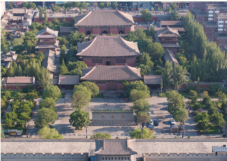
与壮阔的城墙交相辉映的善化寺。