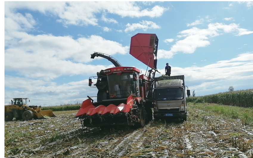
大型一体机收割机正在千亩“富玉”糯玉米种植基地开展机械化作业。