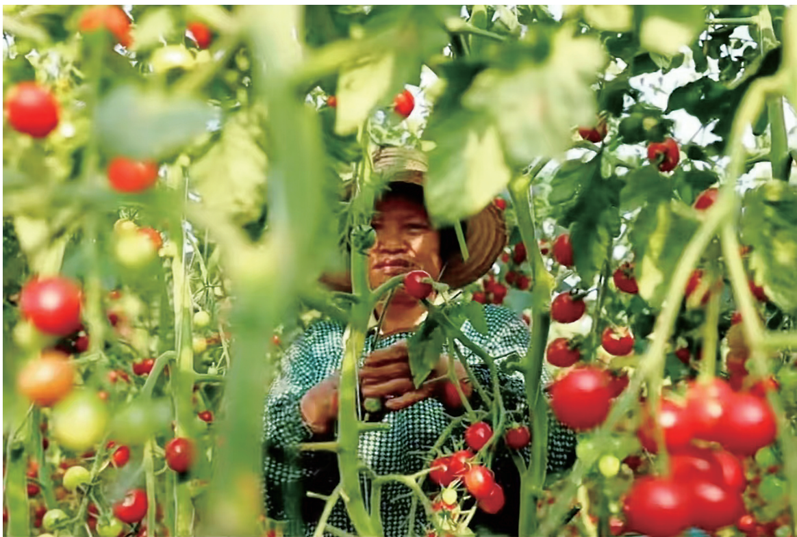
潘寺村农民正在采摘圣女果。