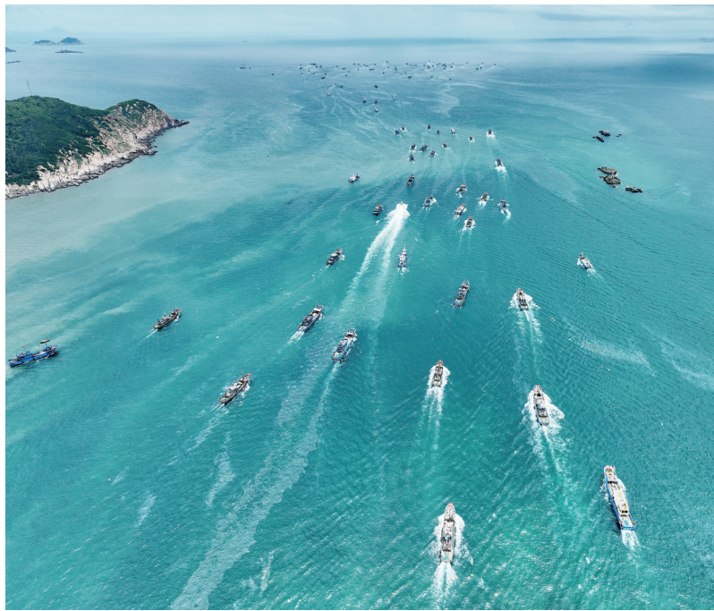
8月16日,在福建省福州市连江县黄岐国家中心渔港,渔船开渔出海(无人机照片)。 当日,福建省部分海域结束为期三个多月的伏季休渔期,渔民开始出海捕鱼。在福州市连江县黄岐国家中心渔港,汽笛长鸣,彩旗齐放,一艘艘渔船扬帆起航,奔向碧波万顷的大海。

请以上公司自登报之日起30日内与我局联系,处理未结清款项的工程项目,逾期未办理的将视为放弃相关权利。我局将对上述款项作留存处理,移除台账管理,由此造成的一切法律责任由对方承担。 联系人: 柴瑞 联系电话: 18903520525 大同市住房和城乡建设局 2024年8月15日