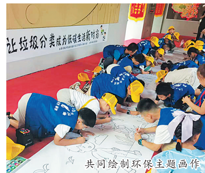
共同绘制环保主题画

“每天扔掉的垃圾都去了哪里？”“垃圾清运车的垃圾又倾倒在什么地方？”带着诸多疑问，7月16日上午，50