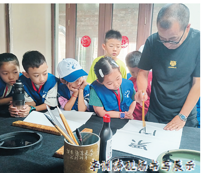
小记者与书法家交流