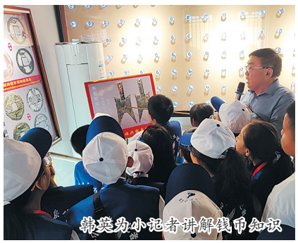
获奖小记者讲解钱币知识

“老师，这是什么茶，好香呀！”当一杯杯热气腾腾的茶摆在面前时，小记者们迫不及待地端起茶杯，细细品味茶的