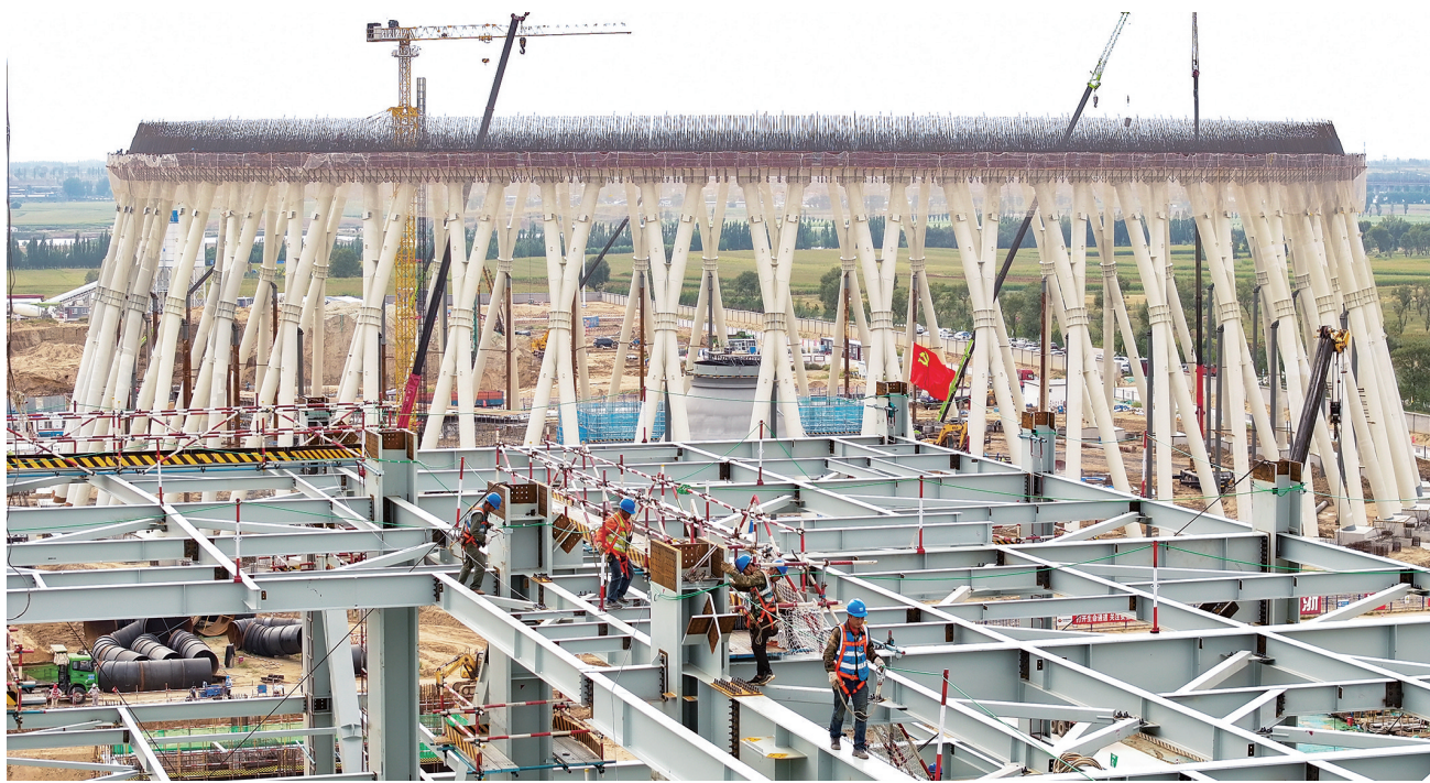
在国电电力大同湖东2×100万千瓦“上大压小”项目建设工地上，600多名工人开足马力，全身心投入“加速”模式，快速推进工程建设。9月2日，1号机组锅炉二层钢架吊装已完成，汽机房8.1米层钢架结构施工完成，1号间冷塔X柱合拢；2号机组锅炉一层钢架吊装完成，汽机房8.1米层钢架结构施工完成，汽机基座至运转层脚手架构架搭建完成，2号间冷塔X柱吊装完成5根/46根。图为工人在1号机组锅炉二层钢架上施工，后面是X柱合拢的1号间冷塔。

全过程人民民主生机无限，良法善治护航高质量发展。前进道路上，我们要坚定不移走中国特色社会主义政治发展道路，不断推进社会主义民主法治建设，为奋力谱写中国式现代化山西篇章提供有力制度保障。 （原载9月4日《山西日报》）