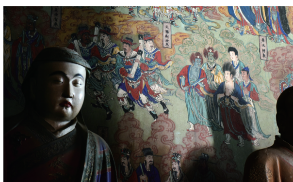
东西墙壁壁画人物众多，形态各异。