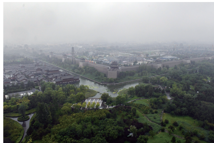
秋雨浸润下，古都大同的上空布满薄雾，为城市带来几分朦胧感的同时，增添了别样的浪漫气息。

干有舞台。按照“5+X”模式，该县安排到村工作大学生在产业振兴带头人、生态振兴守护岗等“五岗十八员”中选择担任“五岗五员”。三地村到村工作大学生通过“党员+大学生+农户”工作模式，帮助村民销售3000余斤西红柿；谢坪村到村工作大学生开展“1+1+N”行动，通过拍摄一部宣传视频，形成一本村情简史，涌现出一大批乡村文旅“代言人”；下乡成立养殖技术交流协会，通过技术交流指导、订单式养殖、直播视频带货，让农村电商“新农人”为乡村振兴注入了强大动力。