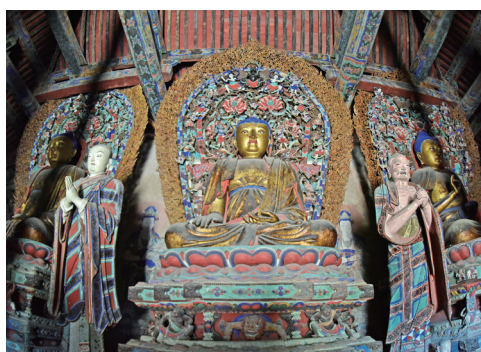
云林寺彩塑、壁画、悬塑三绝汇于一殿。