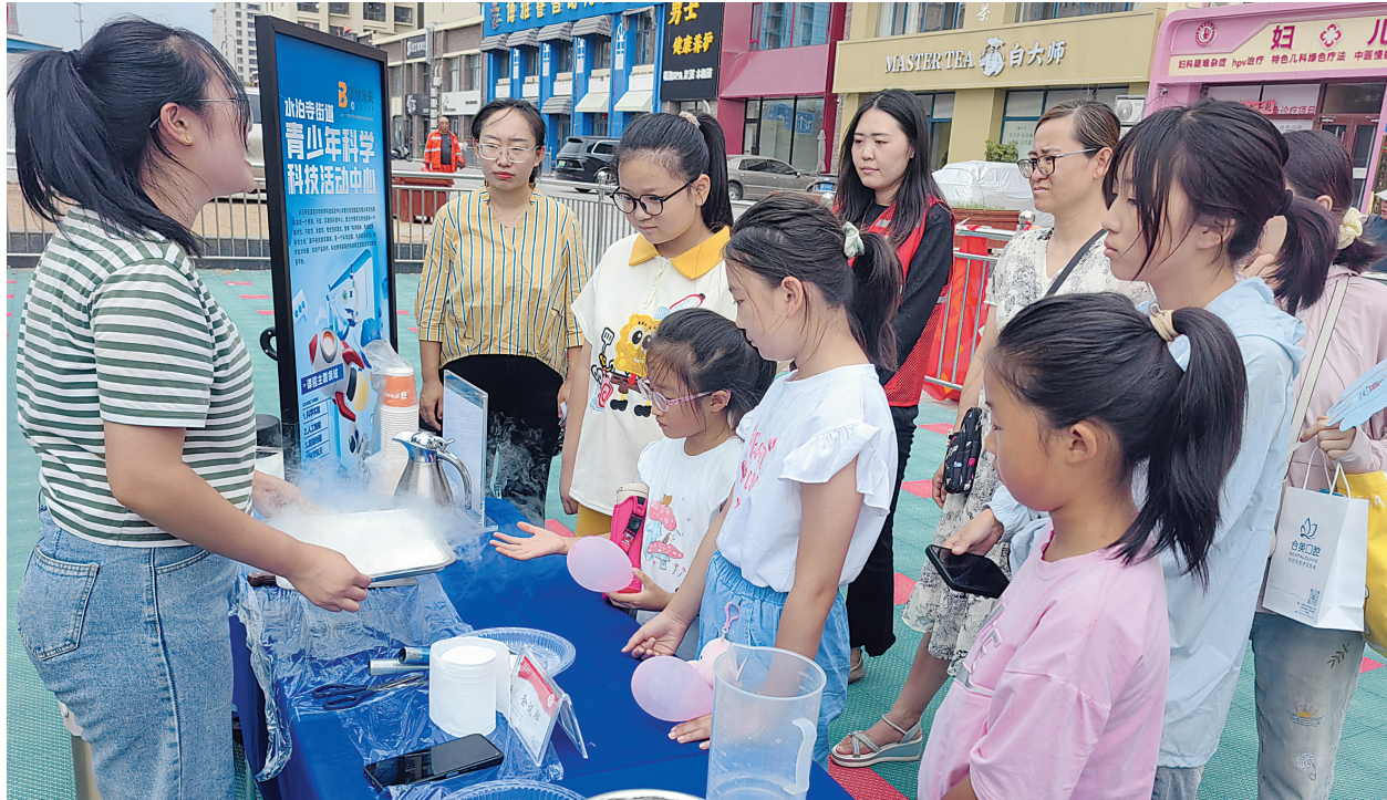
“幸福集市”现场，小朋友们积极参与。