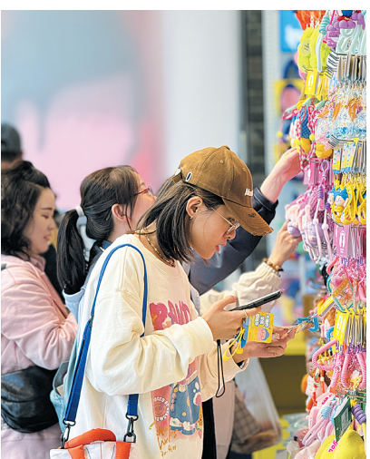
游客在挑选毛绒小佛挂件

秋风送爽，清凉怡人。经历过暑期如潮的客流之后，如今，云冈石窟景区依然吸引许多游客前来旅游观光，有的游客与大佛隔空“击掌”合照，有的游客细致观察静坐的石窟，聆听千年前的刀刻斧凿之声。伴随着山西省文化和旅游局“跟着悟空游山西”活动的火热启动，为进一步吸引游客打卡，活动特别设置了与游戏