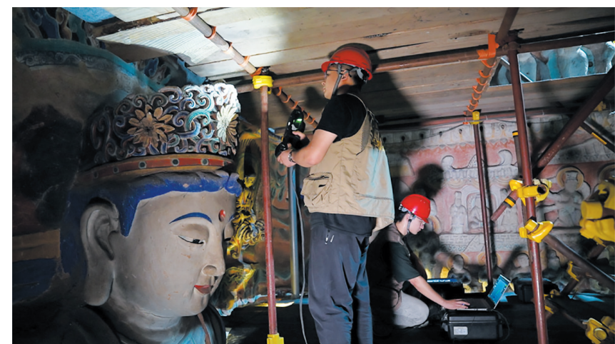
工作人员对石窟进行三维激光扫描