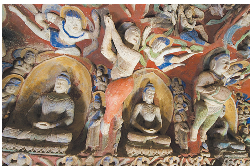
云冈石窟第十二窟“音乐窟”：合掌弹指的“音乐总指挥”