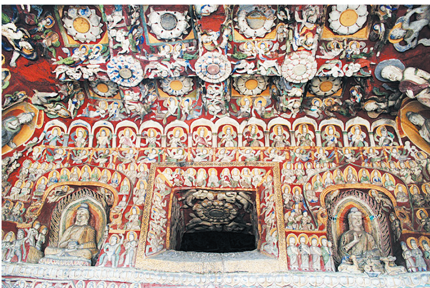
云冈石窟第十二窟“音乐窟”局部图