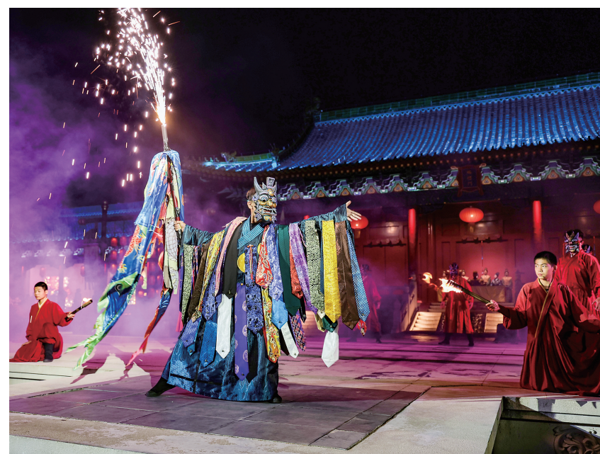
图为中秋假期代王府推出的对月祈福仪式中的舞蹈表演。

本报讯(记者 王春艳)韵味悠长的主题诗会、极具震撼的拜月仪式、趣味无穷的莲花灯制作……中秋假期,我市通过开展丰富多彩的中秋民俗活动,传承优秀传统文化,展现别样魅力。 9月15日下午,作为“聆海文化沙龙”系列活动之一,由市作协指导,市诗歌研究会、大同诗社主办的中秋主题诗会吸引了众多文化学者及诗歌爱好者到来,大家围绕主题,进行文学创作交流,朗诵近期创作的诗歌以及与中秋相关的诗文段落。饱含深情的朗诵不仅营造了浓厚的文化氛围,而且表达了对中秋佳节团圆美好的祝愿,更让中华优秀传统文化进一步传承和弘扬。 9月15日晚,代王府在原有《天下大同》系列演艺基础上,集萃传统文化与非遗艺术,推出了中秋祈福系列演艺和非遗火焰秀系列演艺。演出中,二进院庄重的拜月仪式重现古代皇室对月祈福场景,表达对团圆美满、国泰民安的美好祝愿;三进院“嫦娥奔月”传说再现节目,通过空中