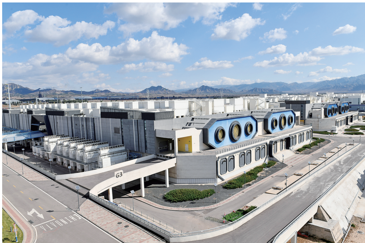
图为秦淮数据集团环首都·太行山能源信息产业基地。资料图片