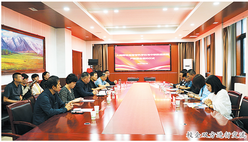
校企双方进行交流