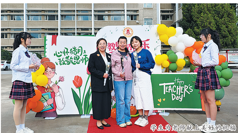
学生为老师献上美好的祝福

一束芬芳的鲜花、一句暖心的问候、一张温馨的卡片……在这个感念师恩的节日里,学生们也以多种形式向辛勤耕耘的教师献上美好的祝福,表达感恩之情。