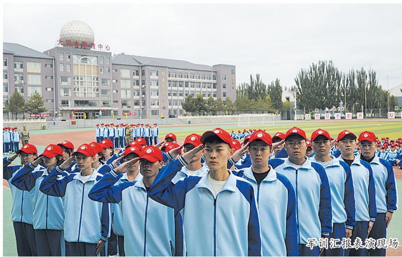
军训汇报表演现场