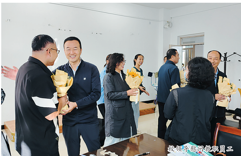
校领导慰问教职工

全体师生满怀信心迎接挑战、追求卓越,以奋斗者的姿态、追梦者的执着,续写职业教育高质量发展的新篇章。