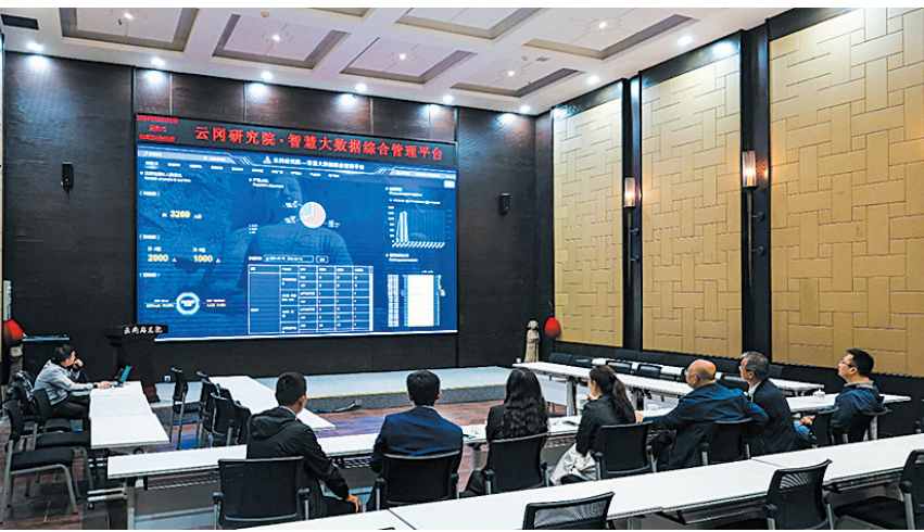
智慧大数据综合管理平台

中秋假期已过,国庆假期将至,在国产游戏《黑神话:悟空》的带动下,大同市的知名度、影响力大幅提升,上榜国内十大热门黑马目的地,并入选2024年中秋假期黑马目的地预测榜单前三。今年暑期,云冈石窟景区游客激增,截至8月21日,景区入园人数已突破300万人次,对比