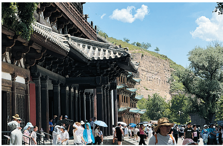
云冈石窟游人如织