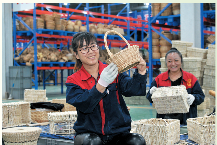
广灵县巧娘公司在编织柳编制品。

行程路线： 得胜堡——万里茶道展馆——市场堡——得胜口——镇羌堡——饮马河——云中伴山民宿。 本报记者 曹飞