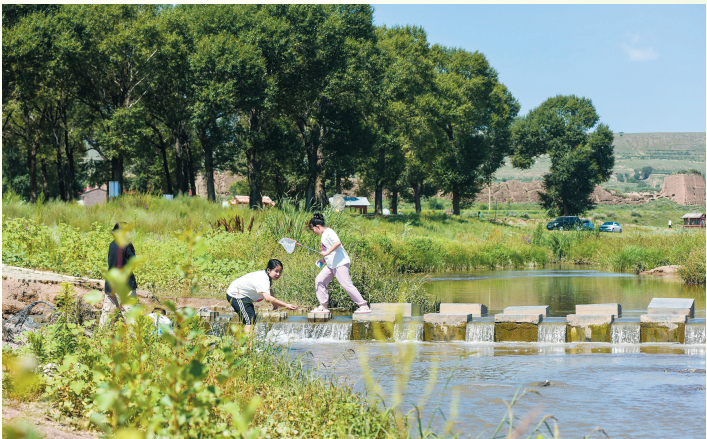
露营饮马河畔，烧烤戏水，放松心情。

此外，西韩岭乡村旅游专线以北村村为起点，途经南村村、南湾村、高店村，至谢店村止，是一条集果蔬采摘、垂钓烧烤、寺庙文化、农产品展销等为一体的大型乡村休闲旅游度假线路，值得一行。魏都水上世界作为一座大型水上娱乐休闲场所，集水上乐园、温泉养生、汗蒸、采摘、垂钓、会议、度假为一体，是云冈区极具特色的科技旅游观光综合体，已成为市民休闲度假的热门打卡地。 本报记者 杨海峰