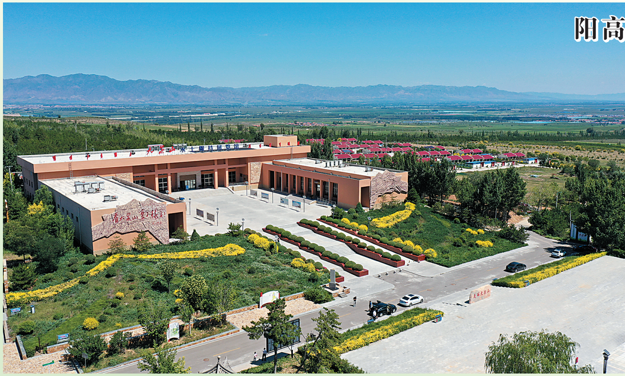
阳高县大泉山水土保持展览馆。

此外，广灵县古韵民俗游也是不错的选择，集古建筑文化、非遗文化及自然风光于一体。旅游资源包括“中国传统村落”河西古堡、“北魏古寺”朝阳古寺、“世界非遗”广灵剪纸艺术博物馆、“手工巧编”巧娘宫编织园区、“丰水神祠”水神堂、“康养圣地”壶流河湿地、“小悬空寺”圣泉寺等，游客既能领略明清时期的古色韵味和广灵剪纸、柳编等民俗传承体验，还能领略到自然风光和人文景观。美食特产有野生苦菜、广灵八大碗、甜糊糊、豆腐干、东方亮小米、甸顶山野生食用菌、画眉驴肉、广灵瓜子等。 本报记者 杨海峰