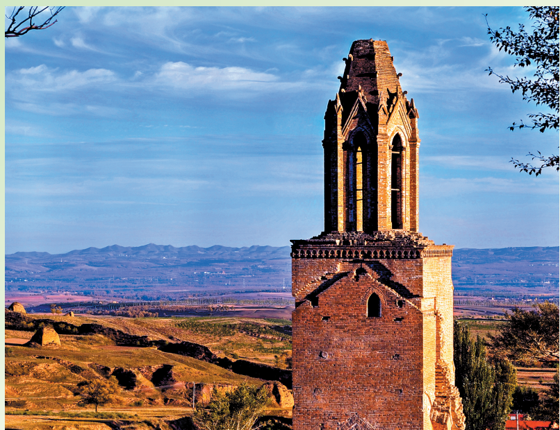
左云县八台子教堂。

之处。此外，十里河湿地生态园区自然植被茂密多样，林间小溪四季潺流，是生态文化休闲旅游之胜地，茂密的植被随地势而高低错落，层次分明，