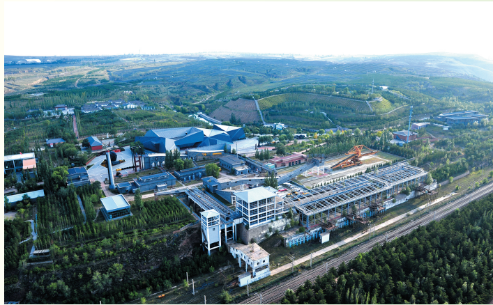
到晋华宫国家矿山公园体验煤炭工业文化。

金秋大同，瑰丽多姿。长城遗址与自然风光融合得更加完美，厚重的历史与壮丽雄浑的塞上风光扑面而来。由各种庄稼组成的色彩斑斓、蔚为壮观的“大地调色板”，两种不同“气质”的碰撞融合，更显得大同风光无限好。国庆假期，想好怎么过了吗？沿着长城一号旅游公路看大同小分队记者带着你品味沿途人文景观的厚重底蕴，尝遍令人食指大动的地道美食。游客朋友们，趁着秋色正浓，来大同走走看看，这是美丽大同向您发出的盛情邀约！