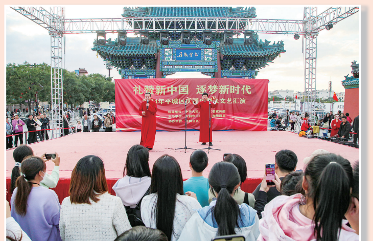
在代王府举办的文艺汇演。