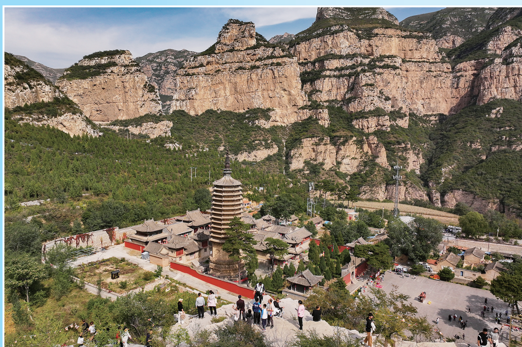
游客打卡《黑神话：悟空》取景地——灵丘觉山寺。