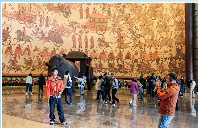
市博物馆成热门打卡点。