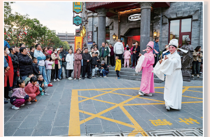
清远街一隅的戏曲表演。

大同之美在于生态大同的清新之美。国庆节当日，一场不期然的秋雪恰成为大同花样迎客的“盛礼”，让人备感惊喜。国庆假期，古都处处花团锦簇，蓝天白云让人心旷神怡，一改对这座传统“煤都”的旧有印象。一座在转型中迸发出全新活力、展现出无限魅力的大同正朝着国际旅游终极目的地的目标坚实迈进。本报记者 史涌涛