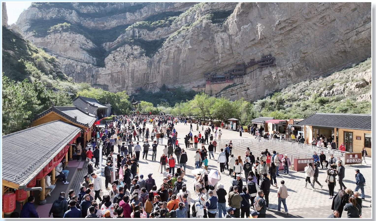
八方游客游览悬空寺。

金秋时节，古都大同秋光明媚，天蓝气清；古城内外，文韵流芳，典雅内蕴；大街小巷，游人如织，欢笑盈溢。每位游客都为大同这份独特的文化魅力所吸引且沉醉，为恢弘壮阔的大美大同所震撼且共鸣，在流连忘返中赞叹不绝。