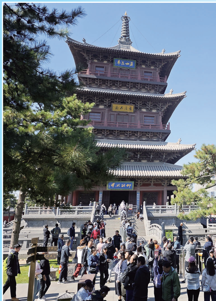
华严寺景区游人流连忘返。