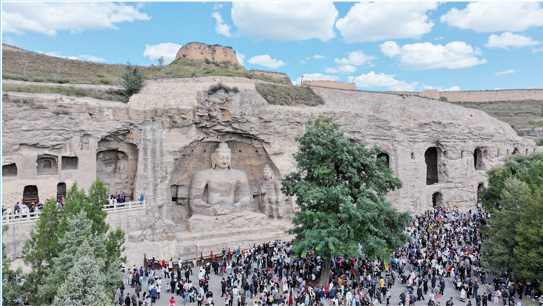
云冈石窟景区游人如织。