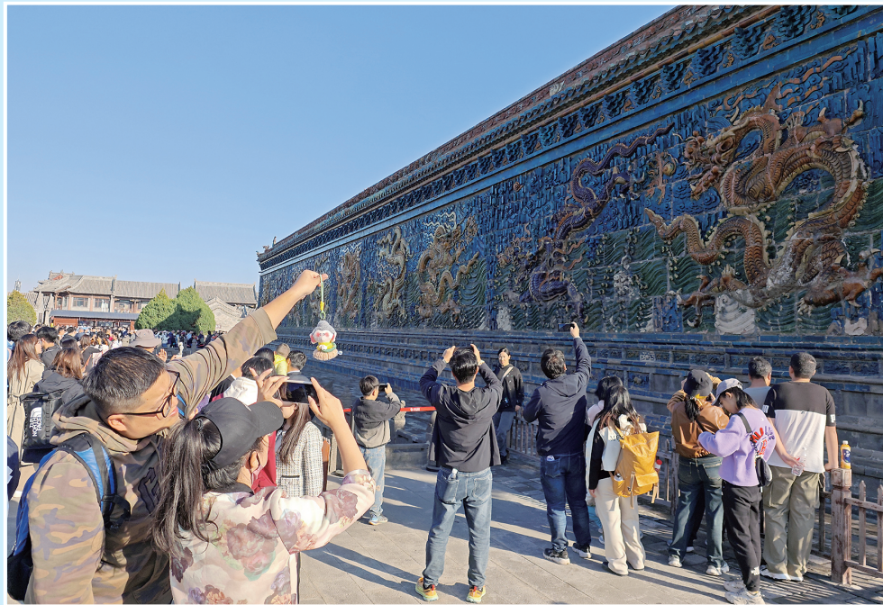
游客在九龙壁前拍照打卡。