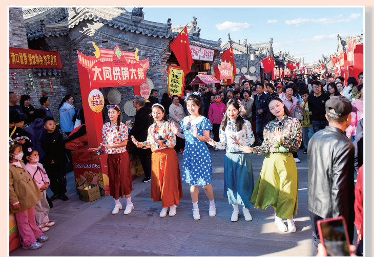
六省市供销大集上演年代秀快闪。