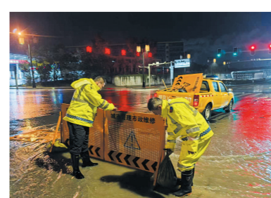
对汛期出现的应急抢修工程，及时研判，立好围挡