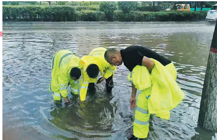
对易积水点进行重点排查，及时进行清理疏通