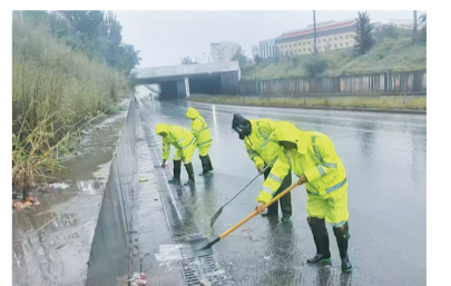
该所工作人员正在进行边沟清淤

汛期，按照应急预案的要求严格落实，执行24小时领导带班和值班制度，时刻做好防汛抢险救灾准备。在降雨前提前揭开盖板、井盖、平算等收水口，设置显著标识提醒过往行人车辆并安排人员把守，避免“窖井吞人”等次