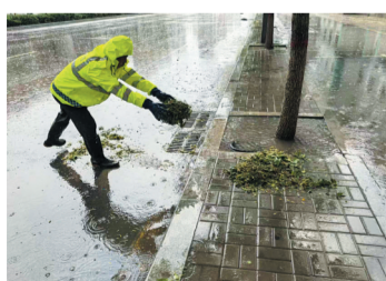
该所人员正在清除被杂物遮盖的雨水井盖

汛期来临之前，该所组织开展了防汛工作动员会，对防汛工作进行了安排部署，组建了防汛抢险小组共15人，做到随时应急。同时认真做好物资储备工作，备足沙袋、铁锹、雨靴、防汛头灯等防汛物资，为道路交通安全奠定了基础。并安排专人做好气象预报的记录预警工作，遇有大雨天气时，能够及时准确地传达到位。