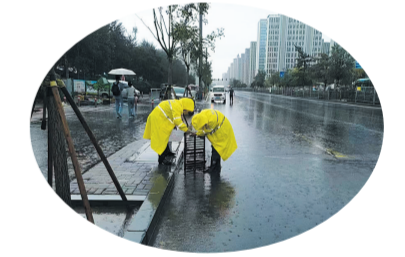
该所工作人员正在恢复清沟后的收水盖板

进入汛期后，该所执行24小时防汛值班制度。按照汛期预警信息，及时在御东辖区进行巡查，重点排查恒安街一医院、重熙街铂蓝郡御河东路口、御河东路小南头下泉段、208国道下穿南环路等易积水点。降雨时，根据雨情在易积