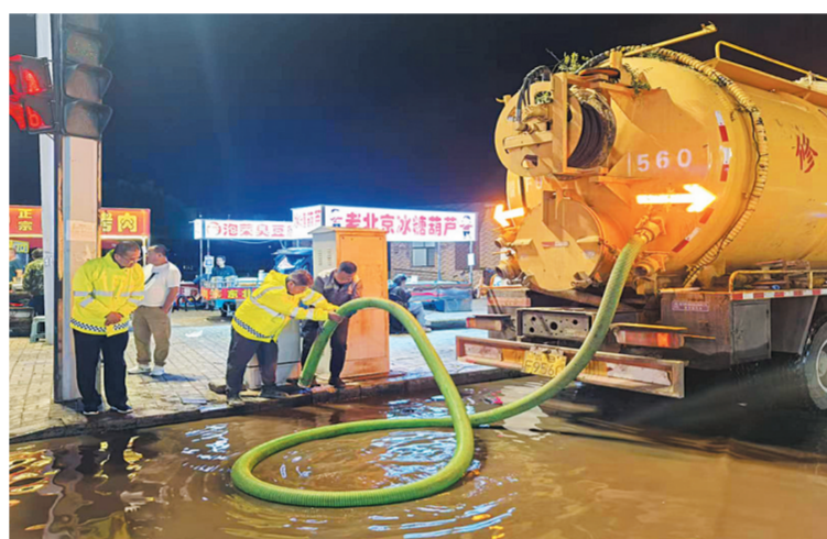
机械与人工相结合对下水管网及部分箱涵进行清淤

今年入汛以来，我市经历多次短时强降雨过程，市城市管理局认真落实市委市政府安排部署，把城市排水防涝工作作为今年汛期的头等大事，健全工作机制，加强预警研判，推进排污清淤，提升防治成效，确保人民群众生命财产安全。