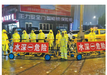
对易积水点进行道路封控导行工作

接到雨情信息，防汛人员便24小时执勤待命。截至目前，出动人员525人次，车辆105台次（与配属单位市政公司、京能热力公司联合行动）前往金牛岗低洼处解决排水不畅问题。及时清除被树叶、塑料袋等杂物遮盖的雨水井盖。雨量较大，雨水井来不及收水造成积水时，立即打开井盖进行助排，同时设置警示标志，提示过往车辆避让，主动协助疏导交通。路面积水后，立即将井盖复原，保障了人民群众生命财产安全及市民群众的正常出行。