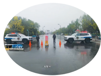
支队工作人员对易积水路段进行封控

面对多轮的强降雨，支队充分发挥防汛主力军作用，执行24小时应急值班和领导带班制度，组织