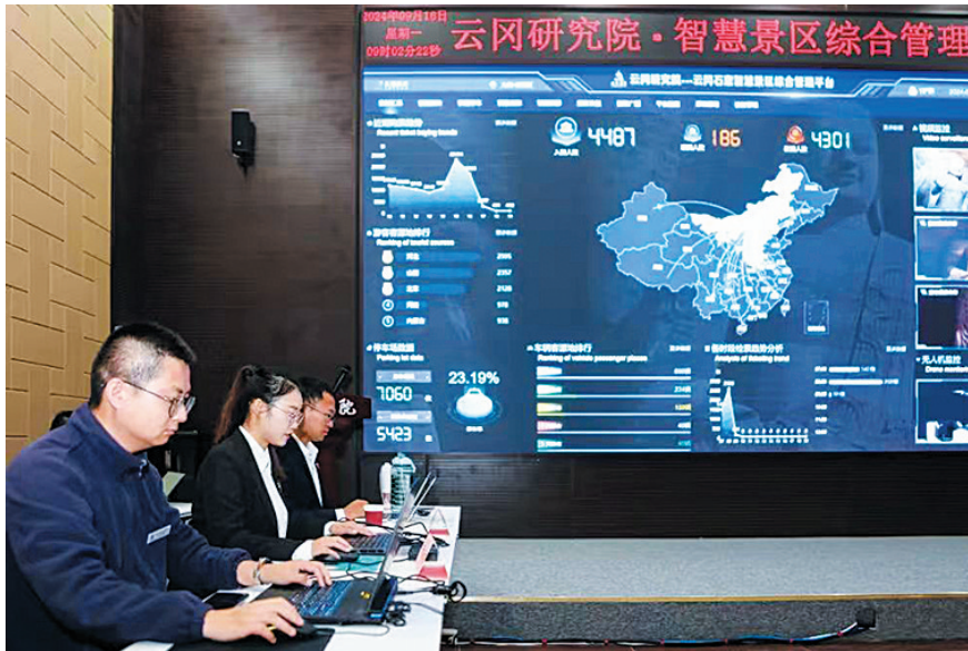
云冈研究院智慧大数据综合管理平台

云冈研究院智慧大数据综合管理平台自9月10日开始试运行，极大地提升了景区管理水平，实现精细化管理。该平台的主界面上，可以细致地看到近期购票趋势、游客客源地排行、当日票务情况、停车场数据、车辆客源地排行、各时段检票趋势分析、窟内视频监控占等等。据数据显示，假期期间省外游客占比84.78%，游客中排名前三的分别是河北