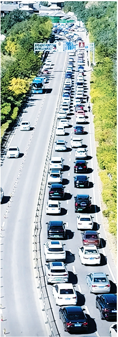
车流量暴增，却来去顺畅

云冈石窟景区坚持以“游客为中心”，推行“五员一体”岗位工作责任制，即每名“云冈人”都是保洁员、咨询员、安全员、宣传员、服务员，持续提升服务水平，并招募志愿者参与云冈石窟景区引导、咨询等服务。云冈研究院联合大同市和云冈区的武警、公安、消防、交警、医疗卫生、市场监管、交通运输管理等相关单位，共同筑牢景区安全防线，营造放心、舒心的旅游环境，迎接每一位远道而来的游客。