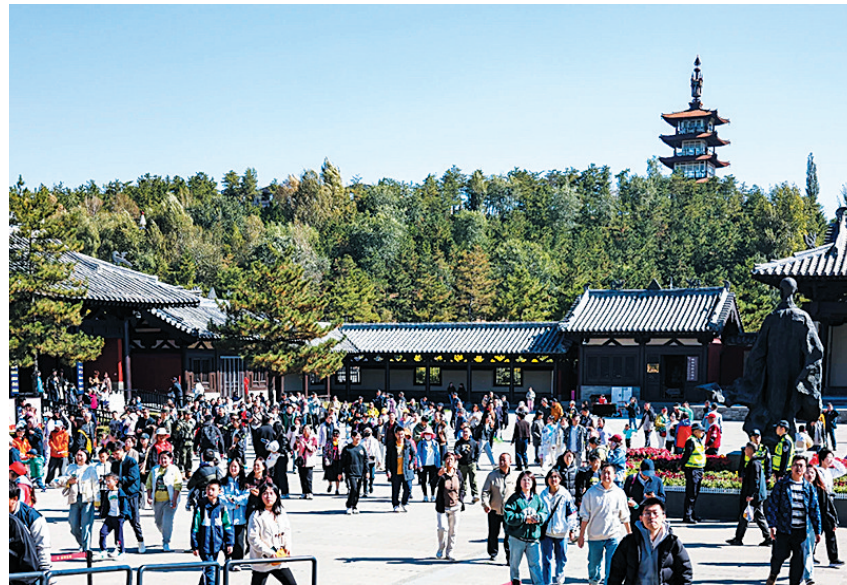
游客众多，井然有序

云冈研究院智慧大数据综合管理平台体现在游客层面是“云冈研究院”小程序，在小程序内可以实现智慧停车、避免盲目寻找车位浪费时间，在出园后进行反向寻车，更精准快速地找到自己的车辆；可以实现智慧票务，平台提供线上购票，游客在预订门票成功