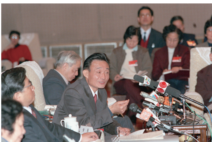
1994年3月，时任上海市委书记的吴邦国同志在全国两会上海代表团全团会议上。