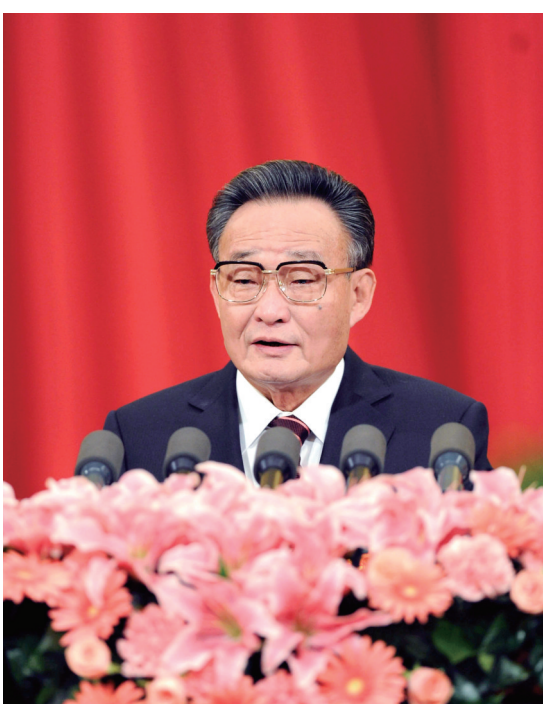
左图 2011年3月10日，十一届全国人大四次会议在北京人民大会堂举行第二次全体会议。吴邦国同志作全国人民代表大会常务委员工作报告。