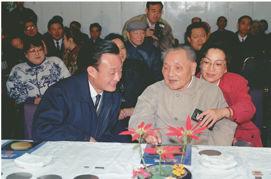
上图 1992年2月10日，邓小平同志在上海贝岭微电子制造有限公司参观时与吴邦国同志交谈。