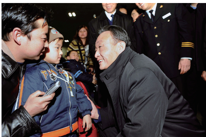
2008年2月3日，吴邦国同志在北京西站候车室与旅客交谈。