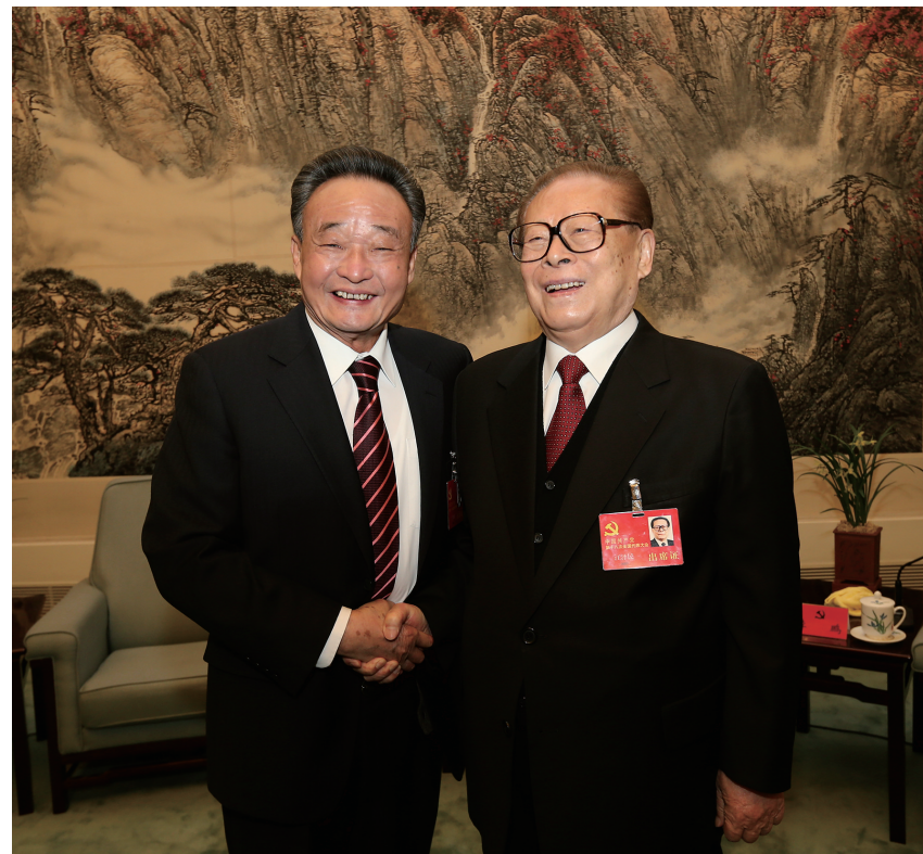
2012年11月14日，中国共产党第十八次全国代表大会在北京闭幕。这是闭幕会前，江泽民同志与吴邦国同志在一起。