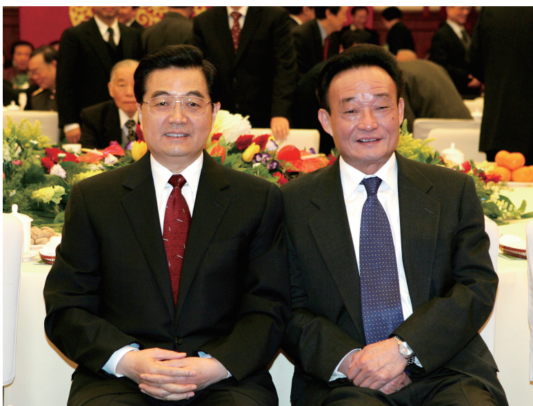
2005年1月1日，全国政协在北京举行新年茶话会。这是胡锦涛同志与吴邦国同志在一起。