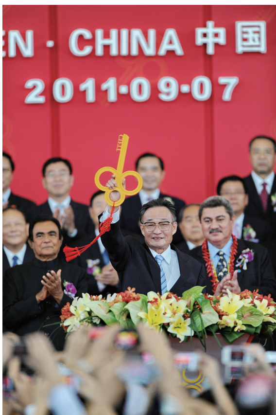
右图 2011年9月7日，吴邦国同志在福建厦门出席第十五届中国国际投资贸易洽谈会开幕式。