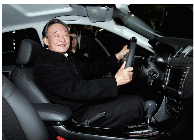
2010年1月30日，吴邦国同志在上海汽车集团股份有限公司技术中心察看新能源车。