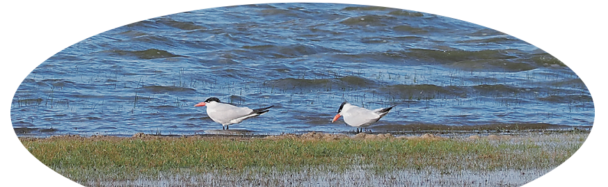
图为在广灵县壶流河湿地首次发现的红嘴巨鸥。

广灵县壶流河湿地的一位工作人员表示，鸟类的数量和种类是衡量湿地生态系统健康的重要指标之一。近年来，该湿地不断加大保护力度，各种珍稀鸟类陆续现身，此次红嘴巨鸥的出现，再次表明壶流河湿地的环境越来越好。