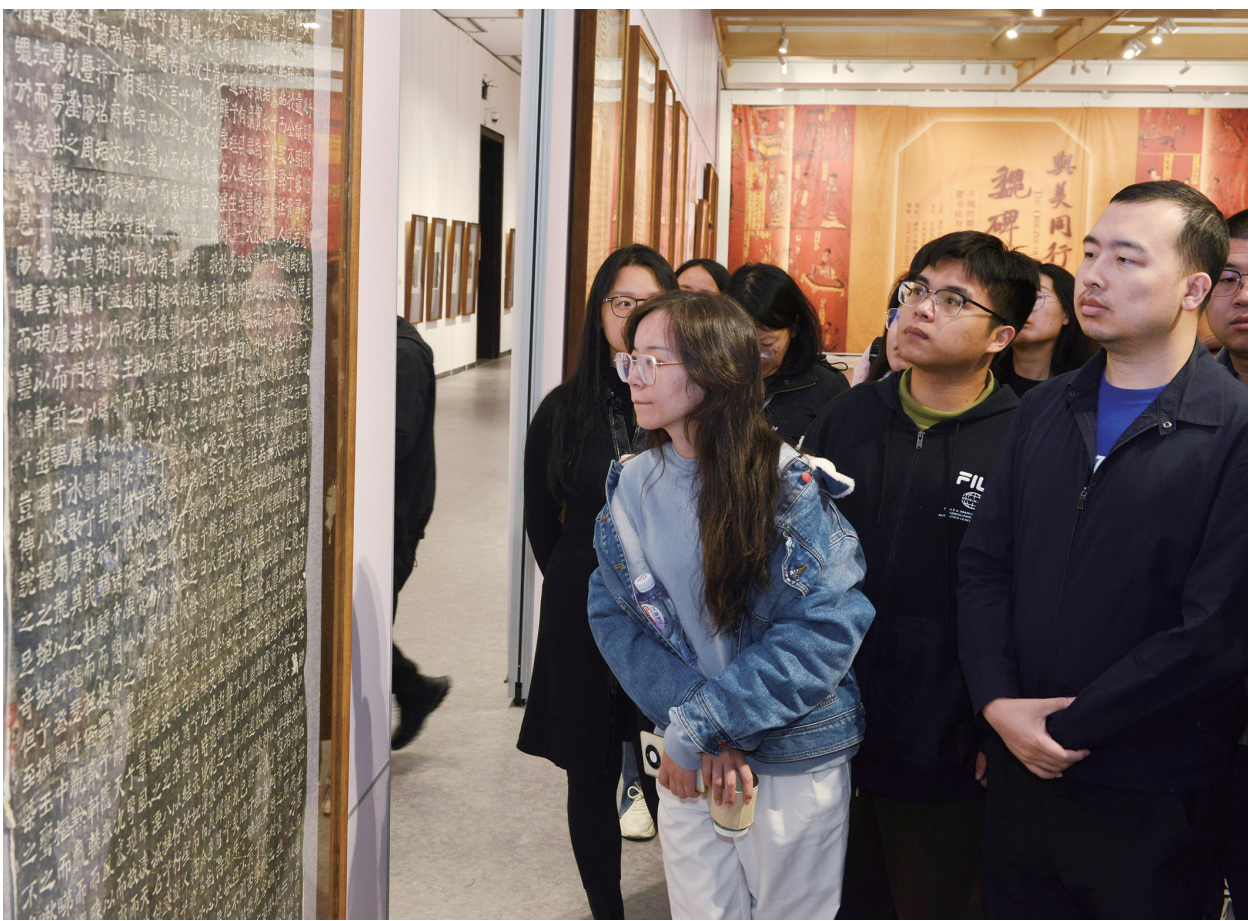
图为清华学子观看“与美同行 魏碑溯源”平城时期魏碑书法艺术展。