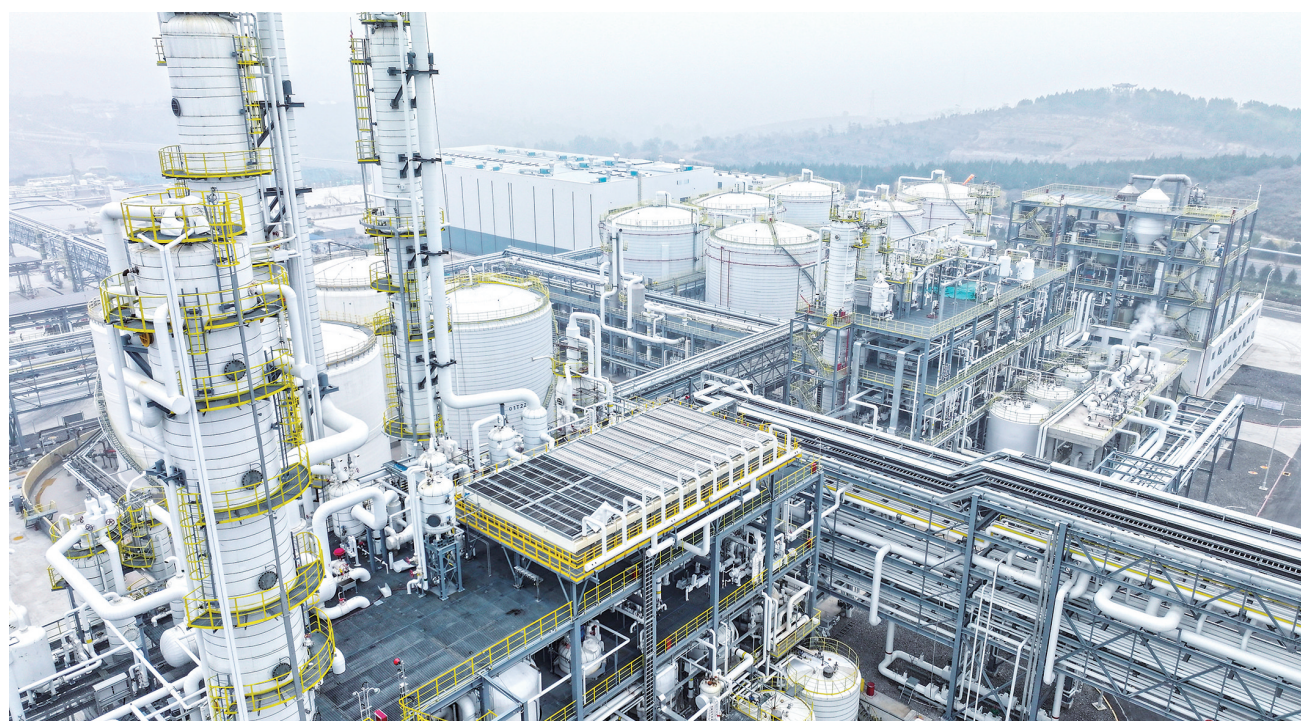
10月31日拍摄的河南省鹤壁市宝山经开区美瑞聚酰胺产业园一角(无人照照片)。近年来，河南省鹤壁市宝山经开区打造现代化工及功能性新材料产业，形成了功能性新材料、橡胶助剂、日用化工、生物化工产业集群，目前已建设完成规模以上工业企业40家。

大同市内蒙古商会成立于2013年，始终秉承“服务会员、回报社会”宗旨，集全体会员力量传承蒙商秉赋、汲取晋商精神，求真务实、开拓进取，商会建设成效显著、价值充分显现。目前，该商会已发展会员企业300余家，致力于发挥自身优势为两地经济协同发展贡献力量，坚持奉献公益事业，在扶贫济困、资助助学中担当社会责任。先后两次被全国工商联评为全国“四好”商会，并被省人力资源和社会保障厅授予“山西省工商联先进商会”称号，成为促进我市经济发展的有生力量。