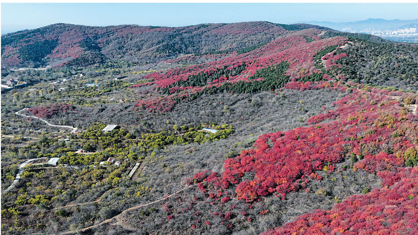
这是天津市蓟州区别山镇红花峪的红叶(11月5日摄，无人机照片)。深秋时节，天津市蓟州区迎来了观赏红叶的最佳时段。枫树、银杏、黄栌等树木在山峦起伏间相继“染色”，美不胜收。据了解，近年来，天津市蓟州区立足京津冀生态涵养发展区定位，通过守山、护水、增绿等举措，坚持走生态优先、绿色发展的道路。

此外，市邮政管理局还将督导快递企业各级网点严格执行禁限寄物品规定，做好寄递安全“三项制度”落实，坚决防止涉枪涉爆、涉黄涉非、涉毒涉危等禁寄物品进入寄递渠道。