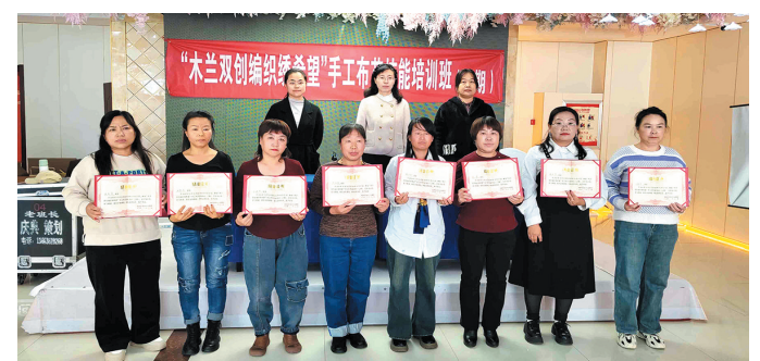
为学员颁发结业证书