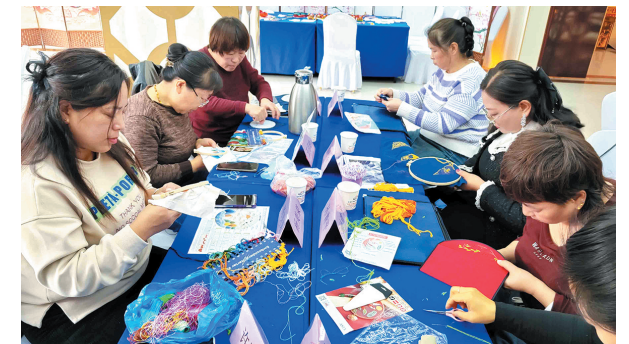
学员认真学习手工

习与实际操作相结合的方式，所有学员全面系统地掌握了刺绣的基本技能。结业仪式上，浑源县妇联主席高芳说，希望广大妇女行动起来，用女性独有的天赋和优势，将所学知识和技能运用到实际工作中，特别是要设计制作出具有浑源特色的手工文创产品，为传承浑源历史和乡村振兴尽自己的一份力量。