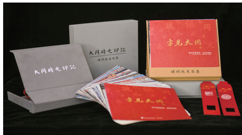
图为《字见大同2025》文创台历。 本报记者 于宏媛

日进行大众网络投票，分数占比60%，大众网络投票环节总票数16万，访问量23万，单幅作品最高投票9186票；9月28日至9月29日进行专家评审，分数占比40%，专家评审团对入围作品进行专业评审，根据题材与内容、创意与构图、光影与色彩等方面现场打分；结合网络评选和专家评审两个环节的计分结果，按权重比例综合计算，最终评选出一等奖2名、二等奖5名、三等奖8名、优秀奖30名、入围奖50名。