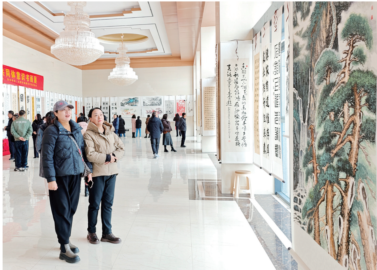
11月26日上午，新荣区统战系统“中华民族一家亲，同心共筑中国梦”——庆祝中华人民共和国成立75周年暨铸牢中华民族共同体意识书画作品展在区工人文化宫一楼大厅开幕。此次书画作品展共征集书画作品150余幅，一幅幅书画艺术作品，展示了新中国成立以来新荣区经济社会发展取得的巨大成就等。