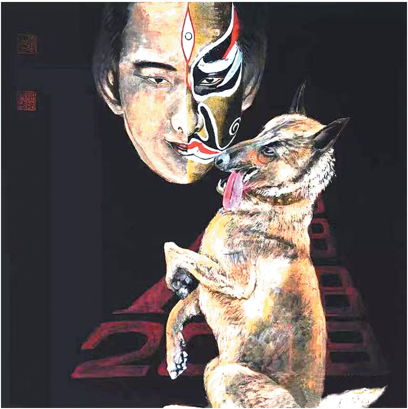
李尔山绘二郎神及哮天犬图