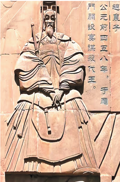
赵襄子毋恤石刻像

(6) 公元前236年，秦王政掀起灭赵之战。战争之始，赵有李牧为将，秦军无以待退。前229年，赵地遭遇饥荒，秦乘机再度伐赵。大将王翦派部分军队长途跋涉围赵都邯郸，自己亲率主力东出井陉。同时，王翦施反间计使赵王夺李牧之帅，以赵葱、颜聚代之。前228年，王翦大破赵军，平定东阳地区（约今河北邢台地区），赵葱战死，颜聚逃亡。秦军南下攻克邯郸，俘虏赵王迁，赵国从此灭亡。赵国公子嘉逃到代地，被赵国旧臣拥立为代王，继续顽抗。【评：这应该算是第三代国了。公子嘉所据“王城”即今河北省蔚县东10公里之“代王城”遗址】公元前222年，秦再度兴兵，王翦之子王贲挥师灭代，代王赵嘉在今蔚州一带苦苦支撑六年，最后被俘自杀，赵国余韵随之彻底寂灭。秦始皇统一中国后，将天下分为三十六郡，代为一郡，领十八县，郡治即在赵公子嘉所居之代王城。