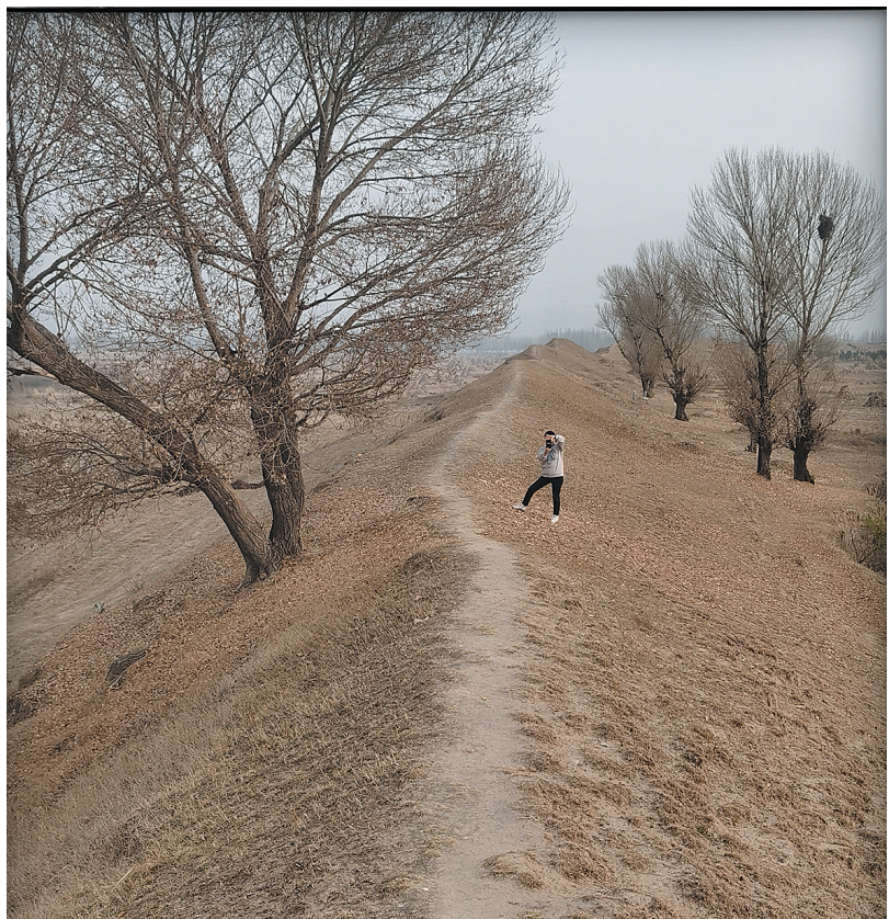
作者在代王城城垣遗址考察