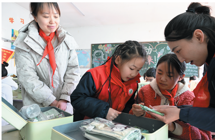
12月3日，市就业创业服务中心的工作人员与爱心企业代表，前往阳高县罗文皂镇平山堡小学和天镇县天城初级中学，把精心准备的学习用品和图书送到两所学校的孩子们手中。本报记者 张占兵摄

本报讯（记者 张志忠）12月3日，市就业创业服务中心携手爱心企业前往阳高县罗文皂镇平山堡小学和天镇县天城初级中学，为两所学校的孩子们送去冬日的温暖与关怀，同时开展了送岗下乡和入户走访活动，将服务和活动紧密结合，持续做好驻镇帮扶工作。